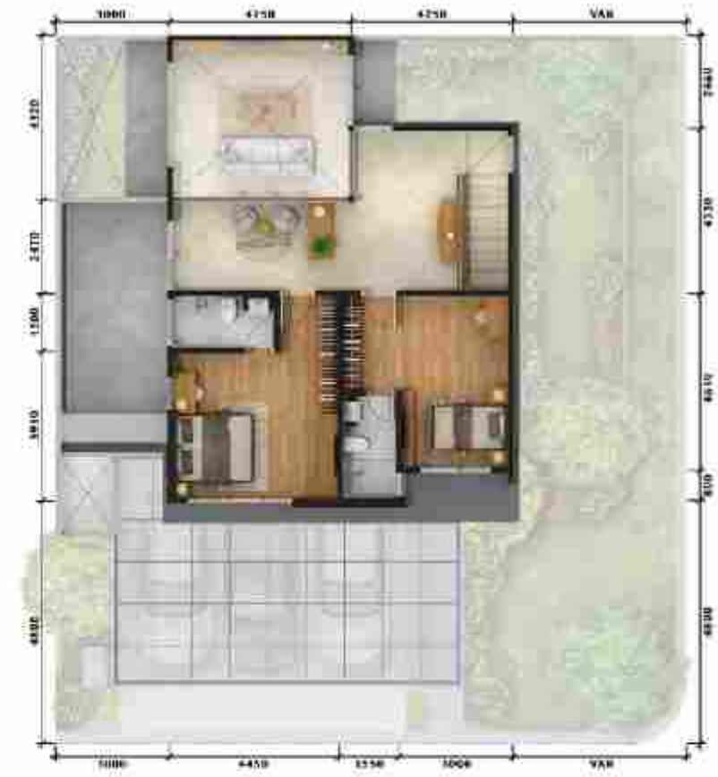
3 rd Floor