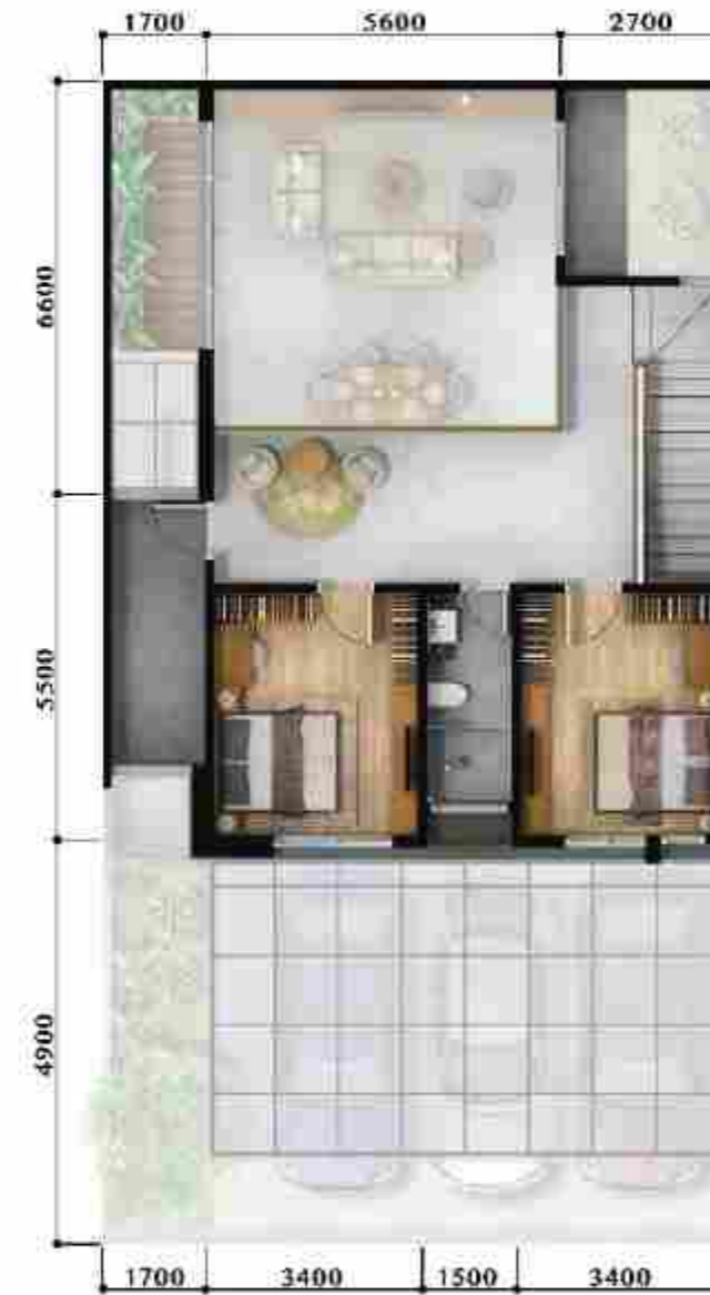
3 rd Floor