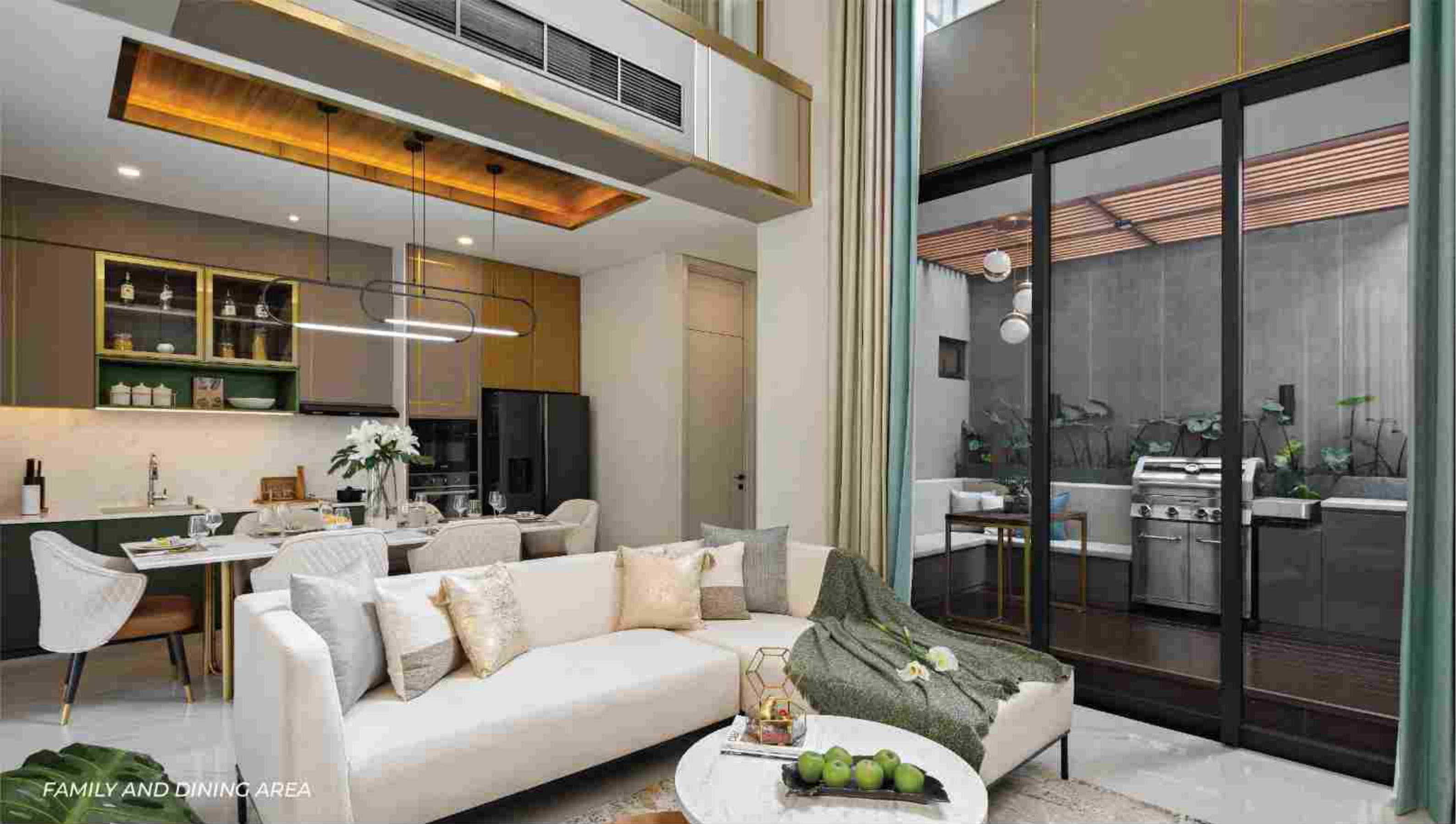
FAMILY AND DINING AREA