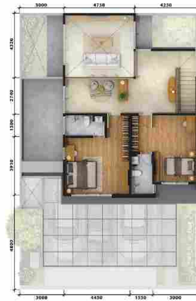
3 rd Floor