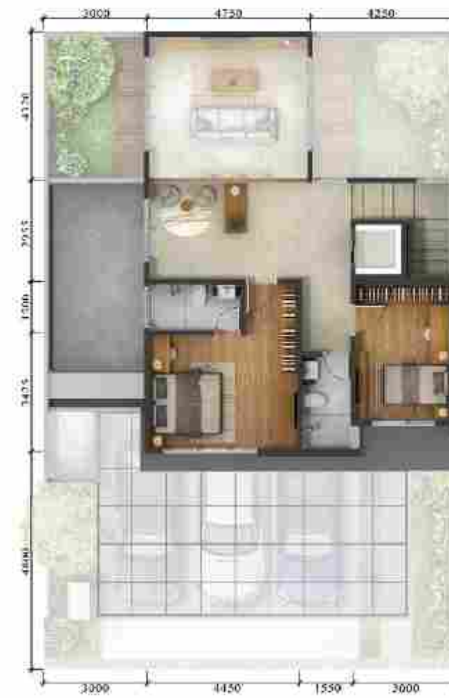
3 rd Floor