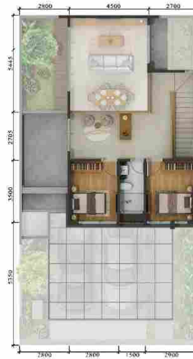
3 rd Floor