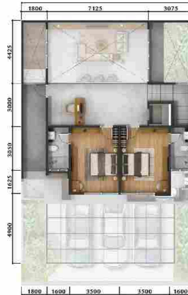
3 rd Floor