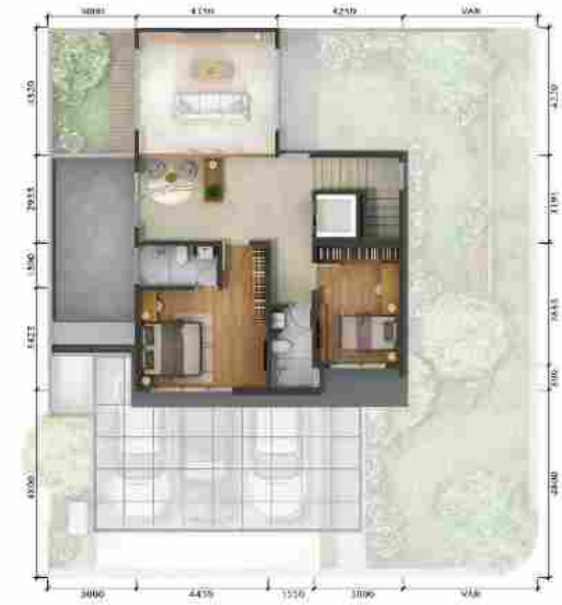
3 rd Floor