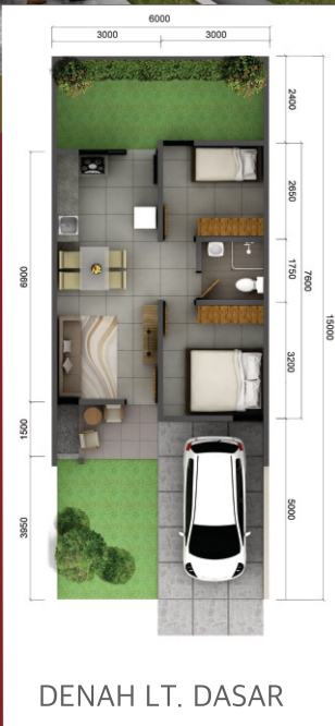
DENAH LT. DASAR