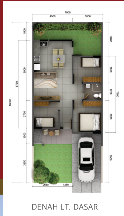
DENAH LT. DASAR