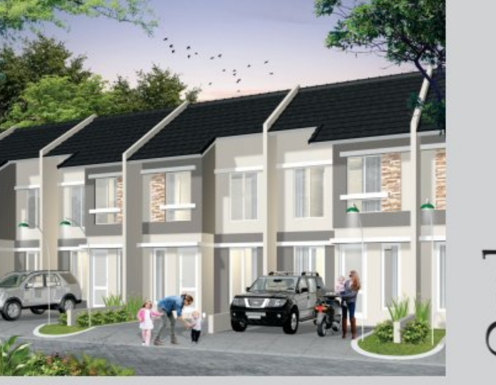
43 & 50