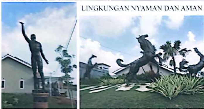
LINGKUNGAN NYAMAN DAN AMAN