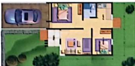
Tipe 67 / 120