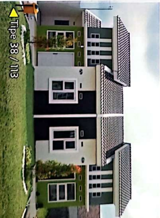
Tipe 38 / 113