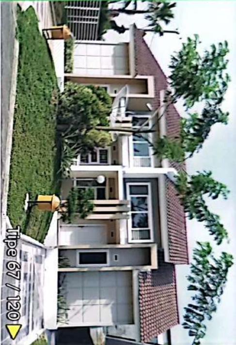
Tipe 67 / 120