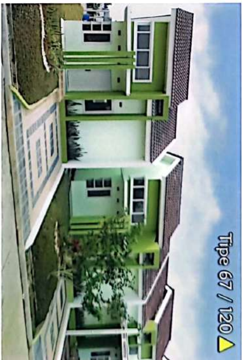
Tipe 67 / 120