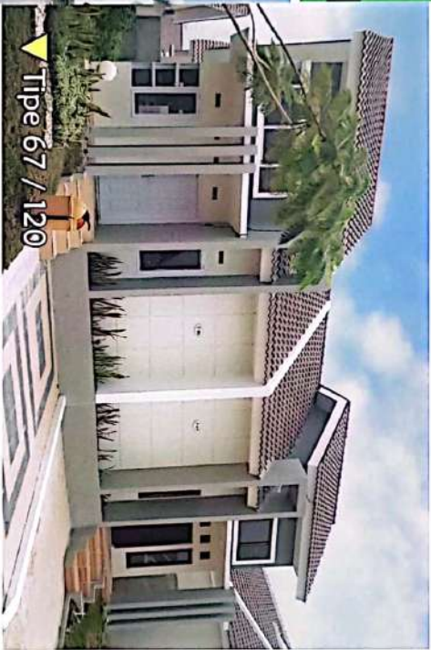
Tipe 67 / 120