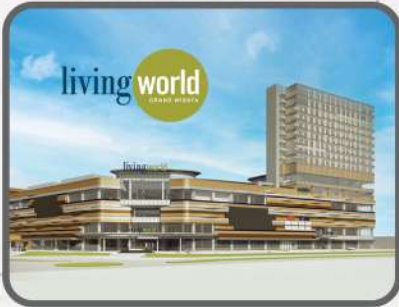
Mall Living World Ready 2024

Beli rumah di Grand Wisata, dengan fasilitas yang SUDAH LENGKAP !