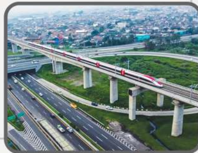
KCIC Operating 2023