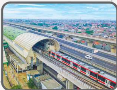
LRT Operating August 2023