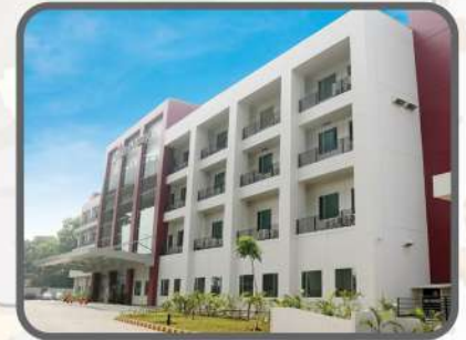
Fasilitas Kesehatan Lengkap