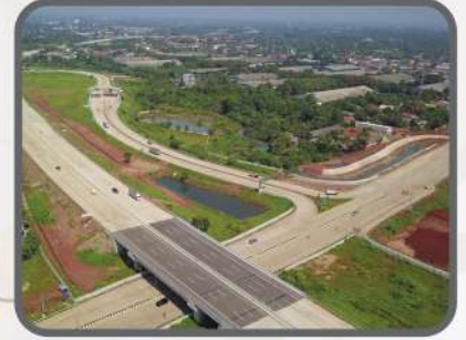
North Setu Toll Exit Operating 2024