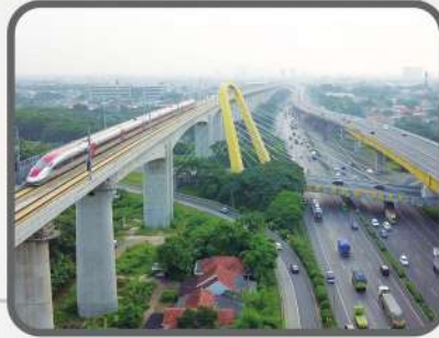
Elevated Toll Ready 100%