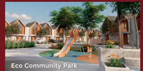
Eco Community Park