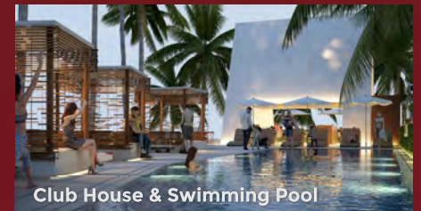
Club House & Swimming Pool