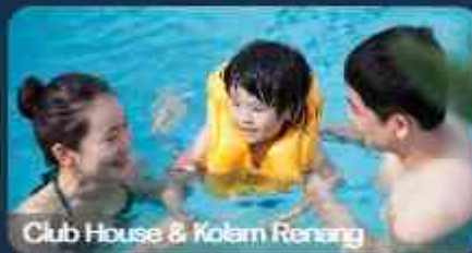
Club House & Kolam Renang