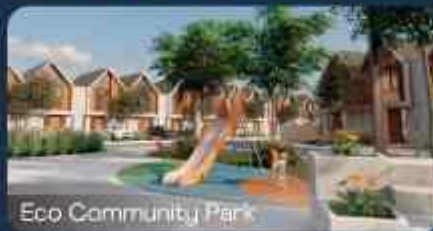
Eco Community Park