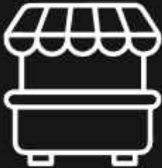
Food Stall Center