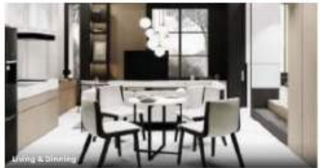
Living & Dining