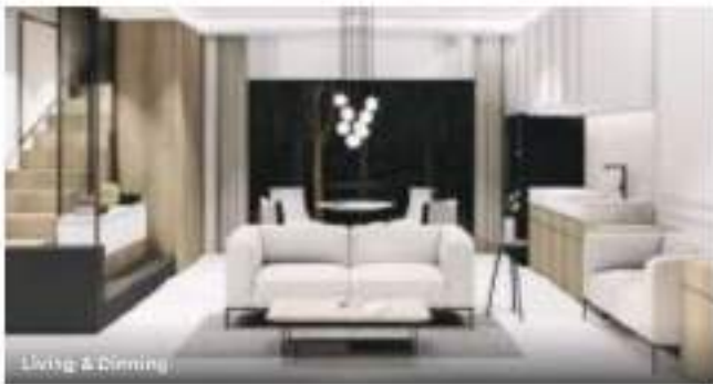
Living & Dining