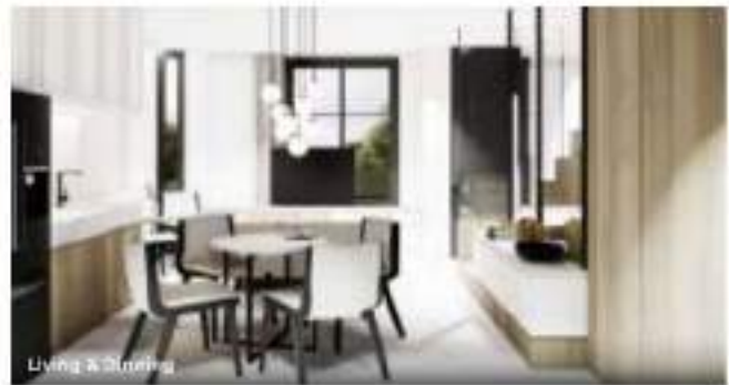
Living & Dining