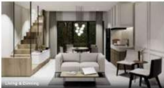
Living & Dining