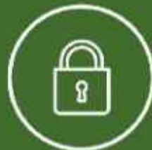
24 HOURS SECURITY