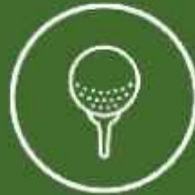
GOLF DRIVING RANGE