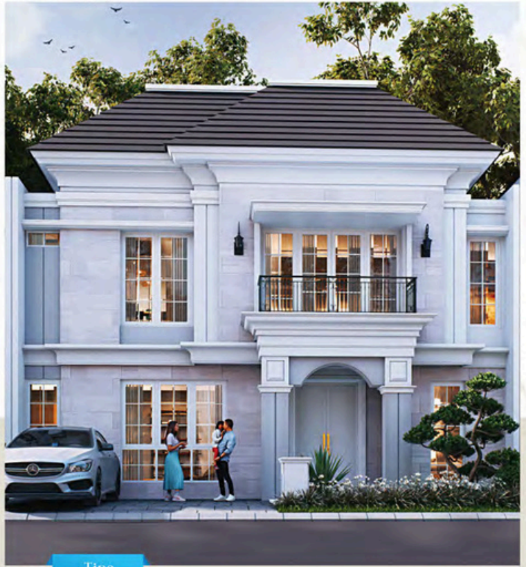
Tipe Premium 12x12

Luas Tanah : 108 m 2 | 🚗 🏠 🚗 Luas Bangunan : 130 m 2 | 4+1 3+1 2