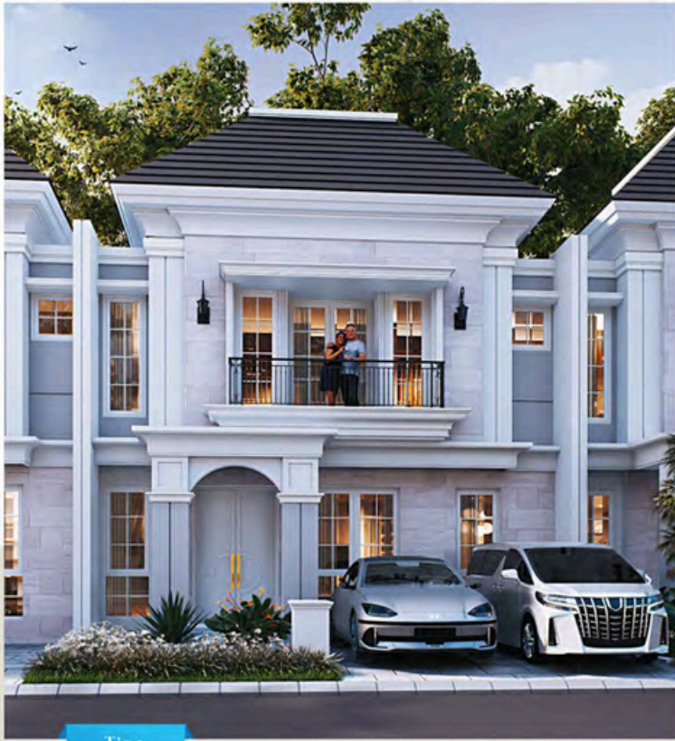
Tipe Deluxe 9x12

Luas Tanah : 108 m 2 | 🚗 🏠 🚗 Luas Bangunan : 130 m 2 | 4+1 3+1 2