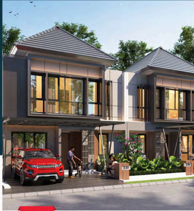
Tipe 8 8x11

Luas Tanah : 88 m 2 Luas Bangunan : 85 m 2