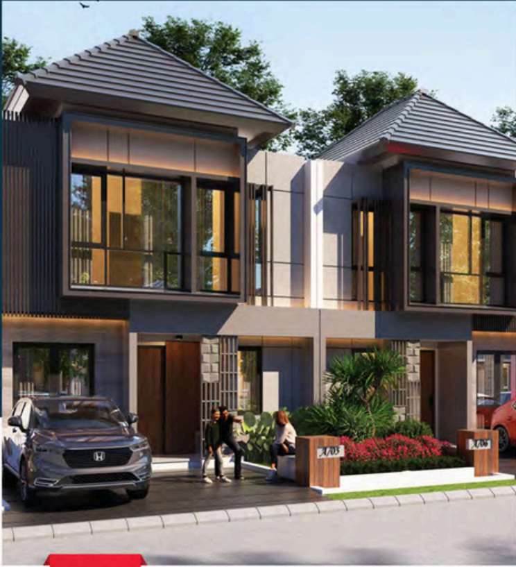
Tipe 7 7x11

Luas Tanah : 77 m 2 Luas Bangunan : 75 m 2