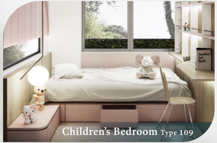
Children's Bedroom Type 109