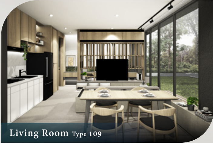
Living Room Type 109