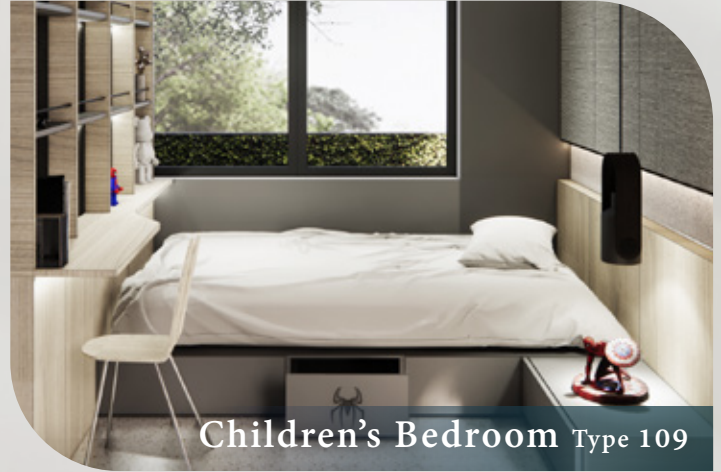
Children's Bedroom Type 109