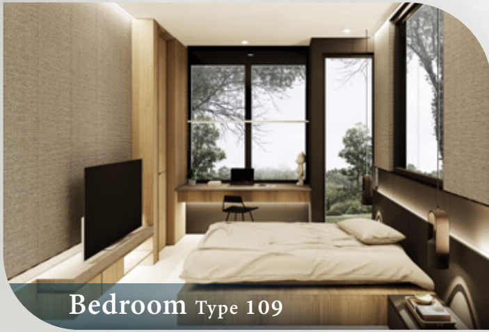
Bedroom Type 109