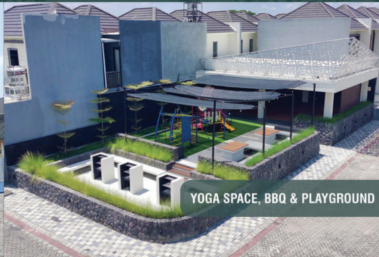
YOGA SPACE, BBQ & PLAYGROUND