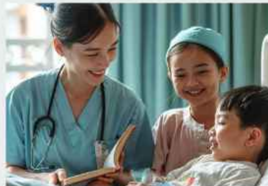
Rumah Sakit Santo Borromeus