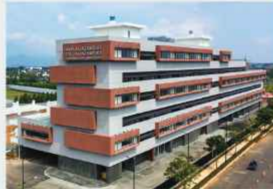
Sekolah Islam Al-Azhar