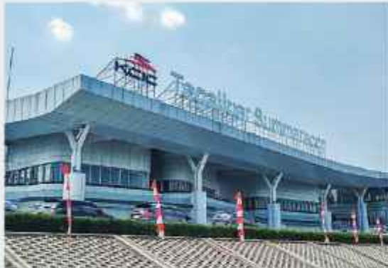
Kereta Cepat Jakarta - Bandung.

Summarecon Bandung menghadirkan berbagai fasilitas terbaik yang sudah terbangun saat ini yaitu Summarecon Mall Bandung dan Sekolah Islam Al-Azhar. Ke depannya akan hadir berbagai fasilitas yang semakin melengkapi kawasan, yaitu Sekolah Terpadu Sedaya Bintang, Setiabudhi Supermarket, Rumah Sakit Santo Borromeus. Hanya 10 menit dari Stasiun Kereta Cepat Tegalluar Sumarecon menuju ke kawasan Summarecon Bandung.