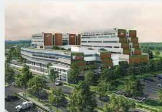
Sekolah Terpadu Sedaya Bintang