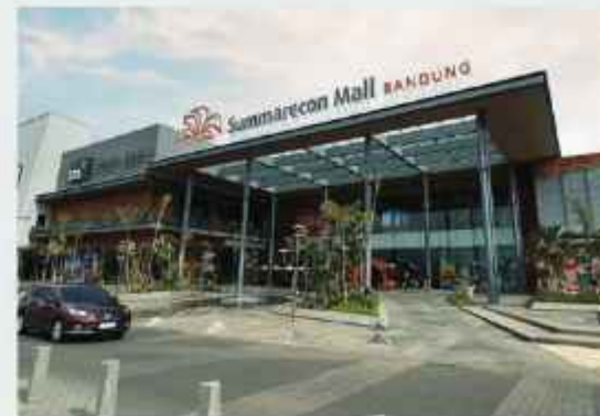
Summarecon Mall Bandung