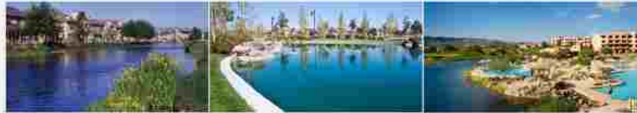
River Islands Lathrop, California