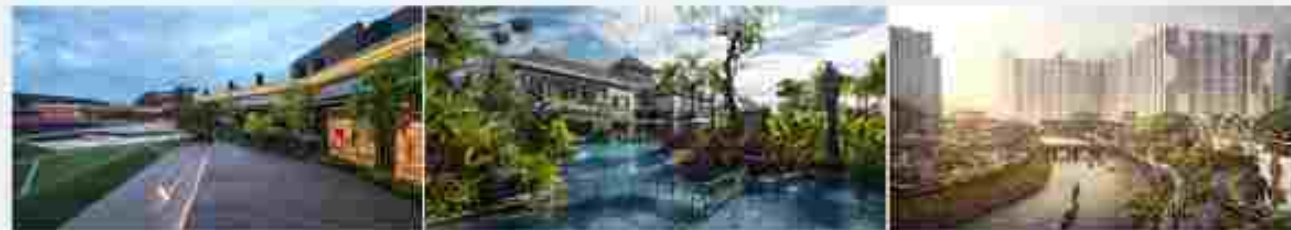
Park Avenue Lifestyle Mall Batam