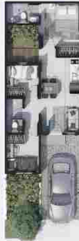
Denah Pengembangan *Optional oleh customer