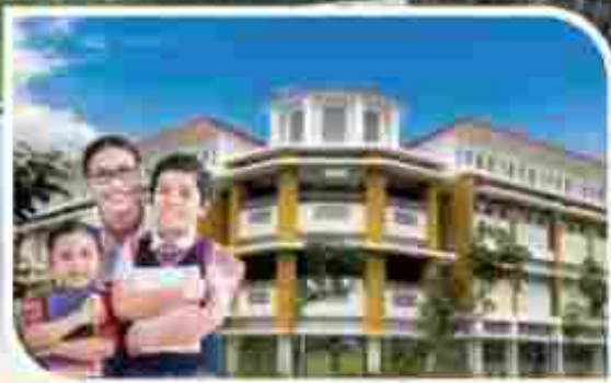
SEKOLAH & UNIVERSITAS