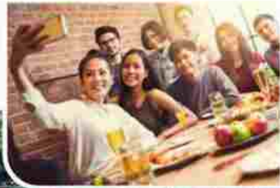
CITRARAYA FOOD FESTIVAL (CIFFEST)