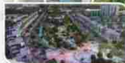
LITTLE KYOTO ECOPARK