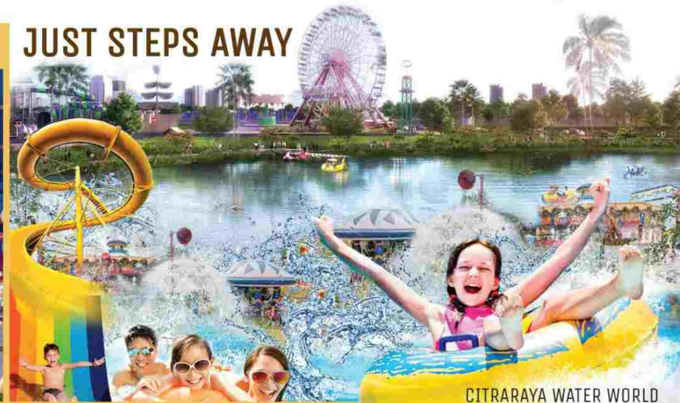
CITRARAYA WATER WORLD