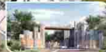
ONE GATE SYSTEM