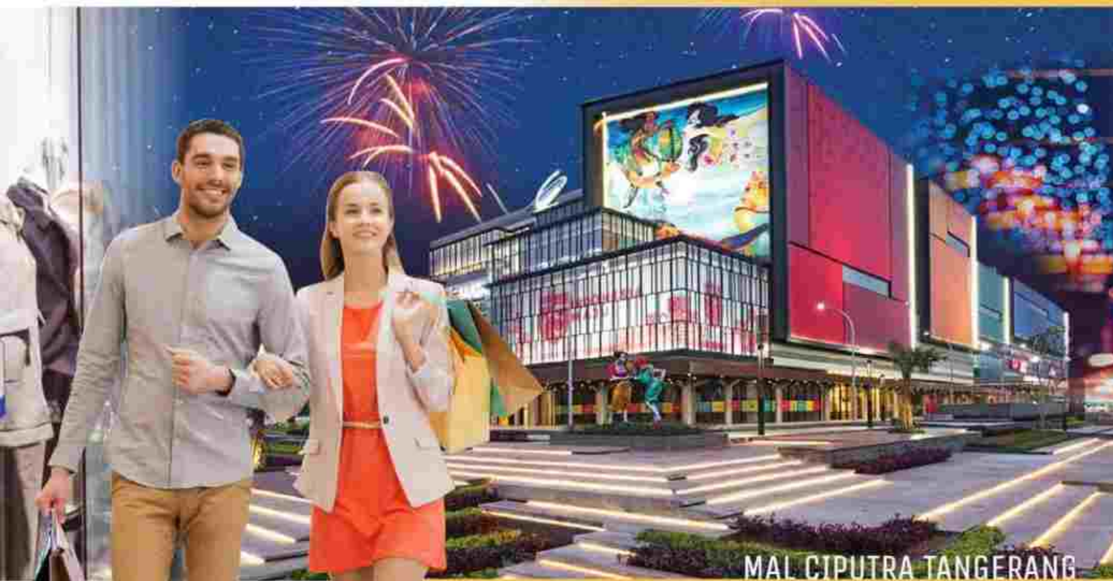
MAL CIPUTRA TANGERANG