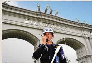
Security 24 Jam