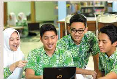
Sekolah Islam Al-Azhar