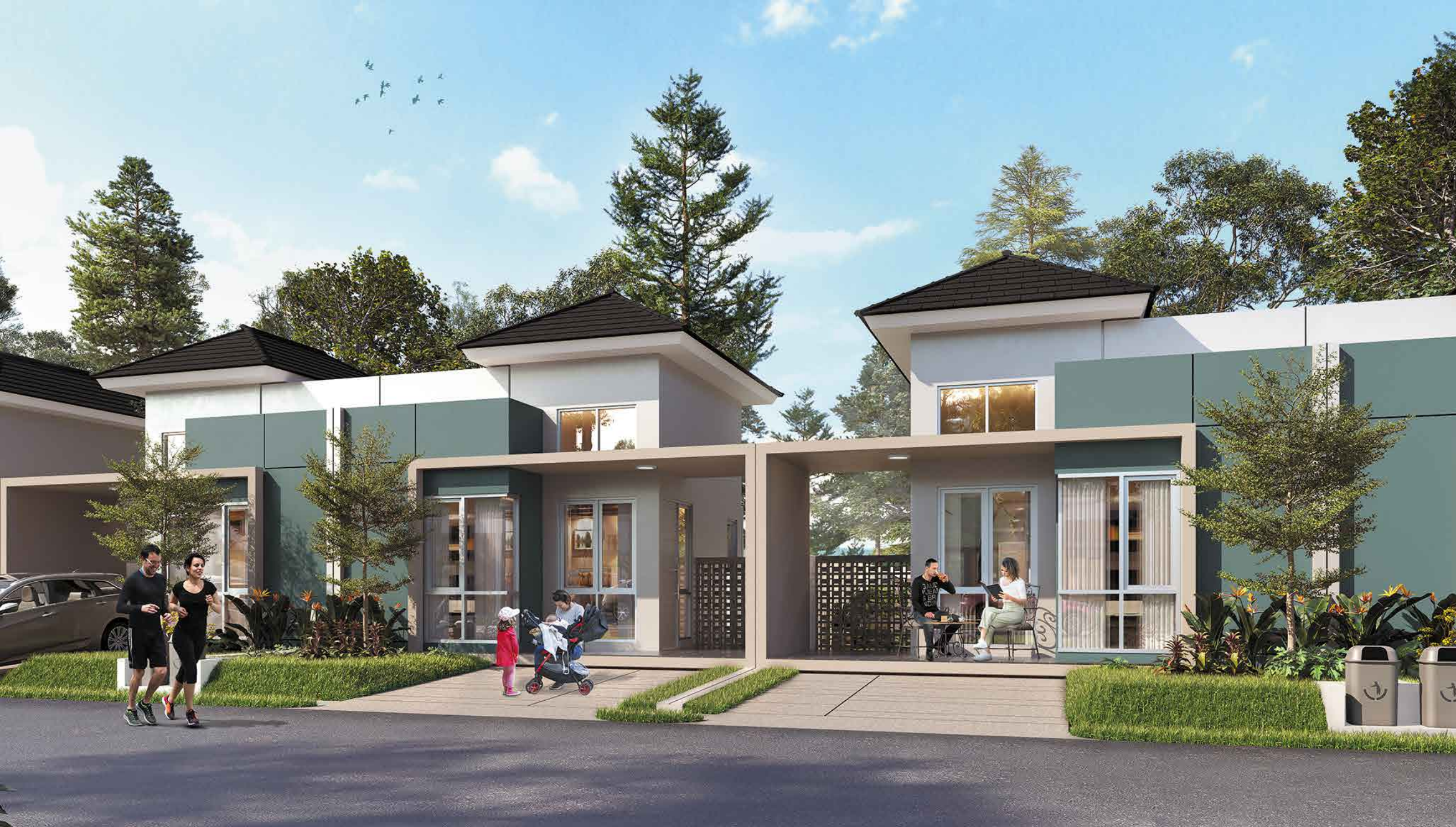
TIPE Azalea LB : 47 m 2 | LT : 105 m 2 (7x15)