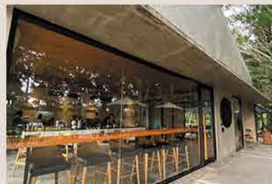
Little Talk Coffee