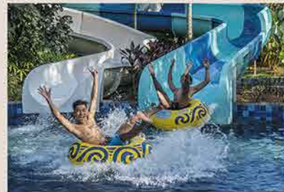
World of Water Waterpark