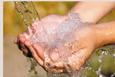
Water Treatment Plant