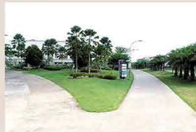
Jalan Boulevard ROW 32