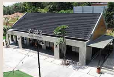
Pine House & Garden