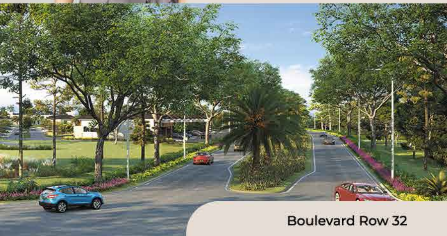
Boulevard Row 32