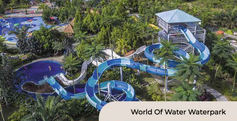
World Of Water Waterpark