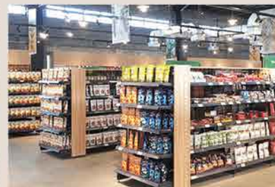
M Bloc Market