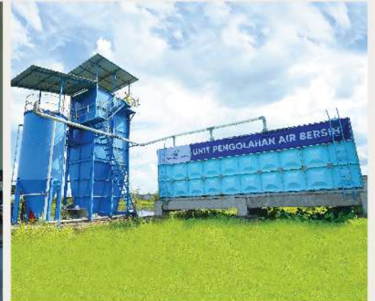
Water treatment plant