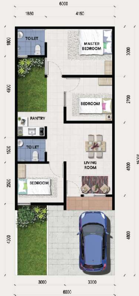
Marigold A LT: 90m 2 / LB: 52m 2

Seluruh ruangan memiliki ventilasi / jendela untuk cahaya matahari dan sirkulasi udara yang alami. Untuk kenyamanan ekstra, setiap ruangan diatur sedemikian rupa dengan memperhatikan tingkat privacy dan pergerakan dari setiap anggota keluarga.