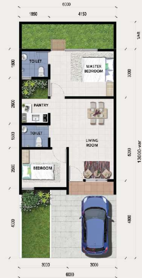
Marigold B LT: Var/LB: 45m 2