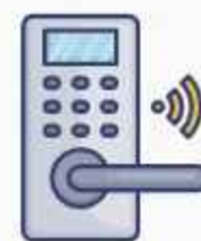
Smart Door Lock