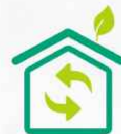
Eco Home Concept

Disclaimer: All information and specifications are current at time of print and are subject to change as may required and cannot form part an offer to contract. Rendering and illustrations are artist's impressions only and can not be regarded as representation of fact.