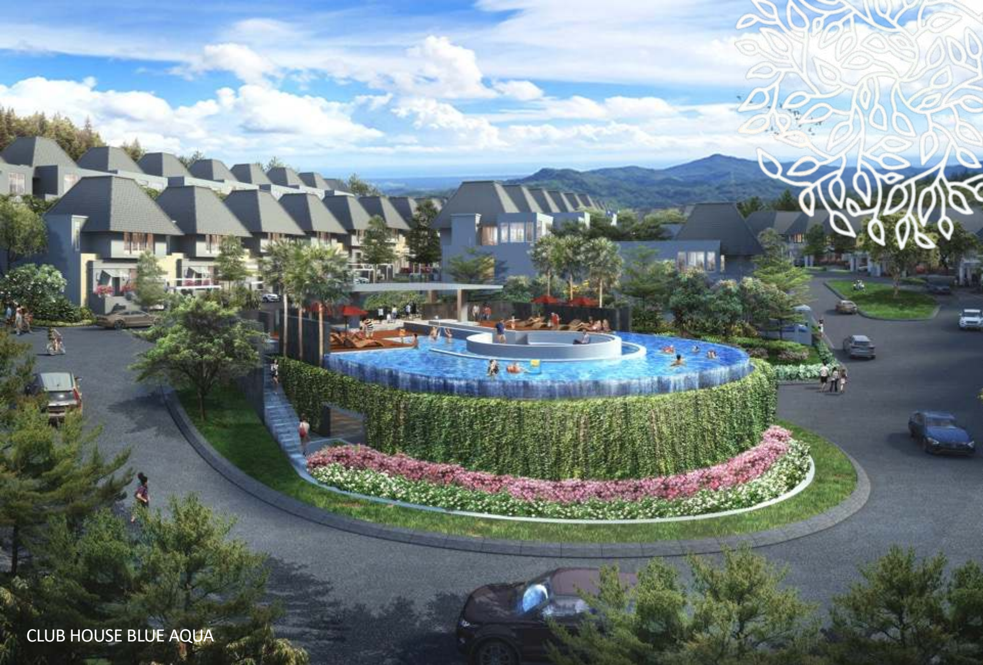
CLUB HOUSE BLUE AQUA