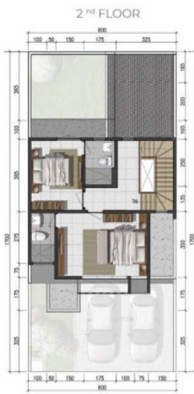
Caladium LT. 136 LB. 146