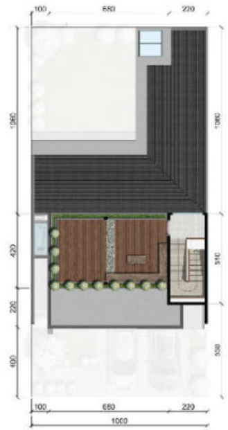
ROOFTOP PATIO FLOOR