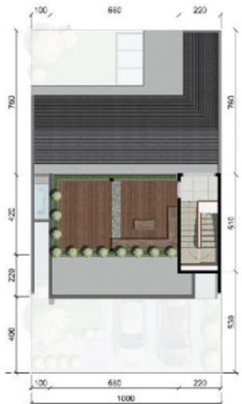
ROOFTOP PATIO FLOOR