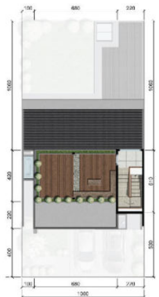
ROOFTOP PATIO FLOOR