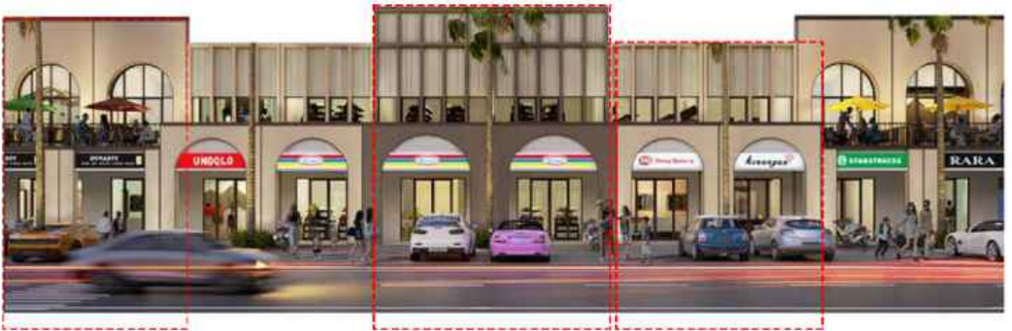
Lebar 4 Fasad B

Ruko perdana di CitraLand City Kedamean cocok untuk segala jenis usaha anda. Dilengkapi balkon dengan view Theme Park, halaman belakang yang luas untuk pengembangan usaha.