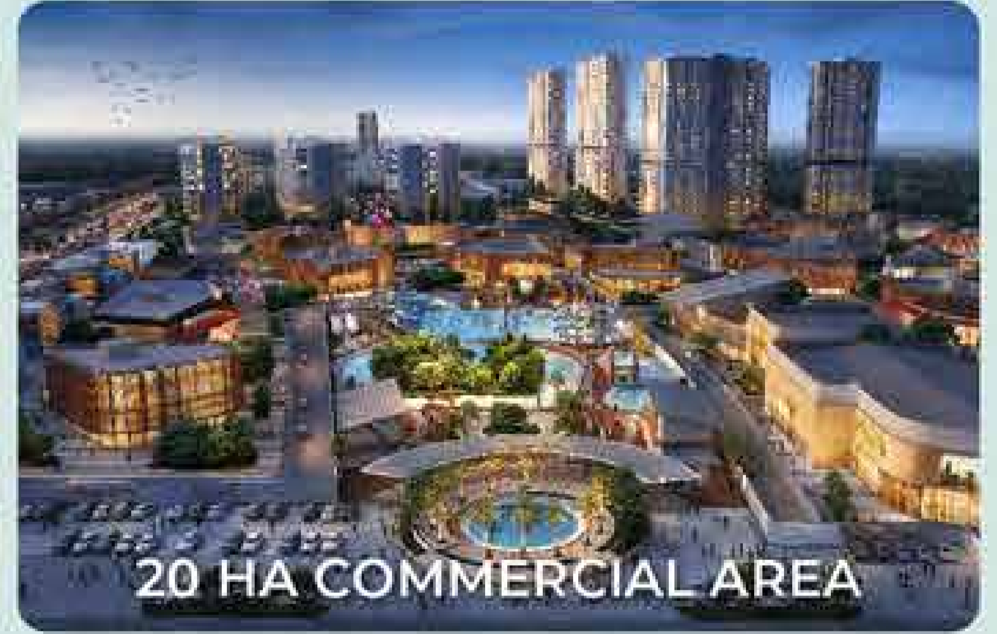
20 HA COMMERCIAL AREA