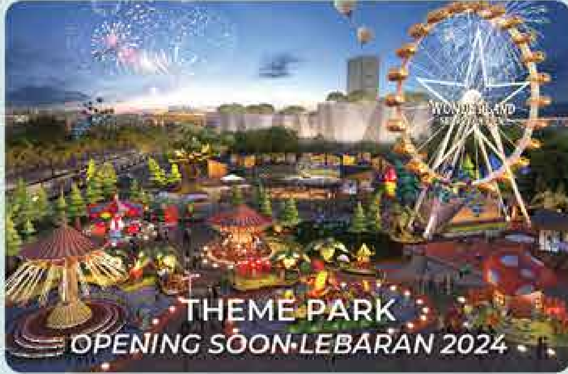
THEME PARK OPENING SOON - LEBARAN 2024