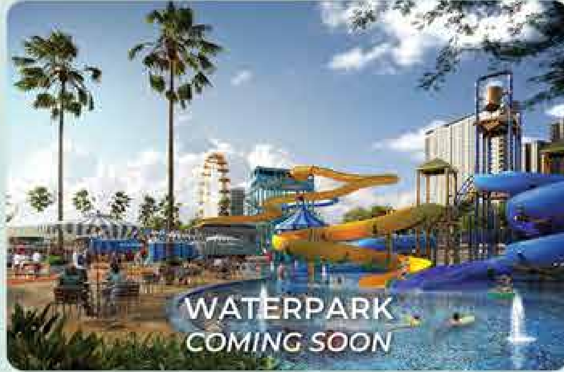
WATERPARK COMING SOON