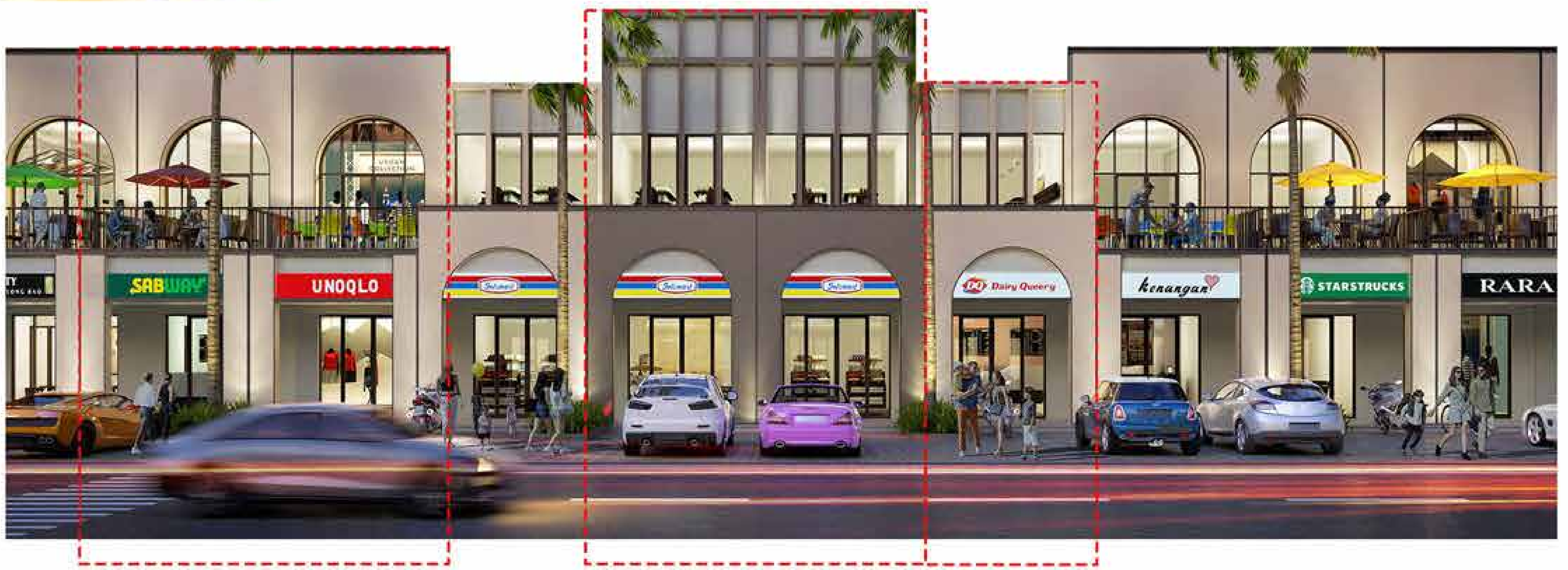
Lebar 4 Fasad B

Ruko perdana di CitraLand City Kedamean bergaya klasik modern cocok untuk segala jenis usaha anda. Dilengkapi balkon dengan view Theme Park, taman yang luas untuk pengembangan usaha, serta akses privat ke lantai 2.