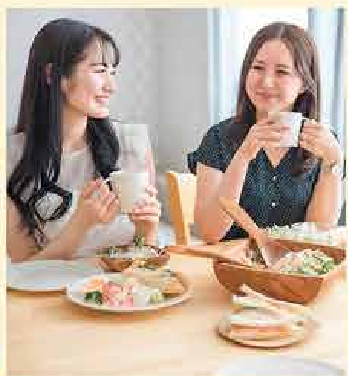
CAFE & RESTO