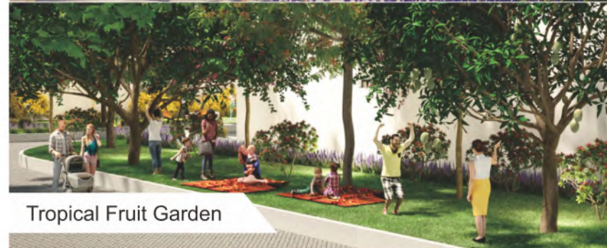
Tropical Fruit Garden