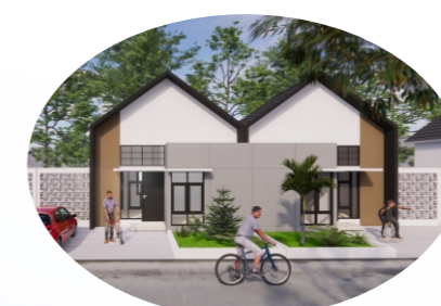
TAMPAK TIPE 36/120