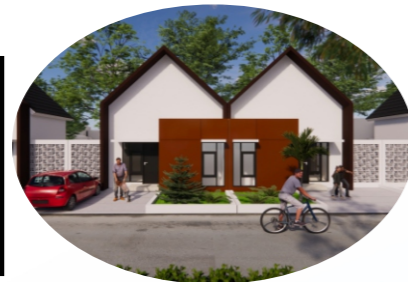
TAMPAK TIPE 30/90