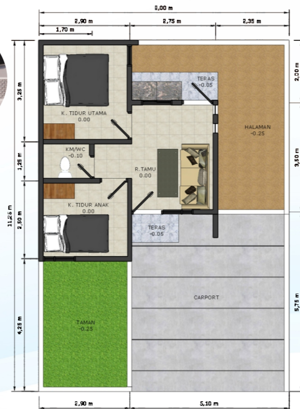
DENAH TIPE 30/90 *Tanpa Pagar Keliling