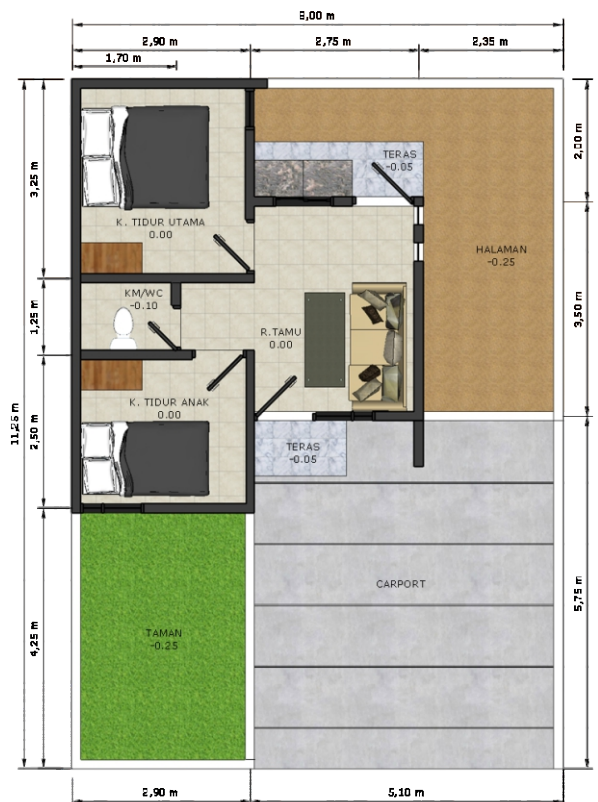
DENAH TIPE 30/90