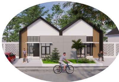
TAMPAK TIPE 36/120