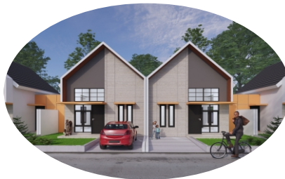
TAMPAK TIPE 45/120