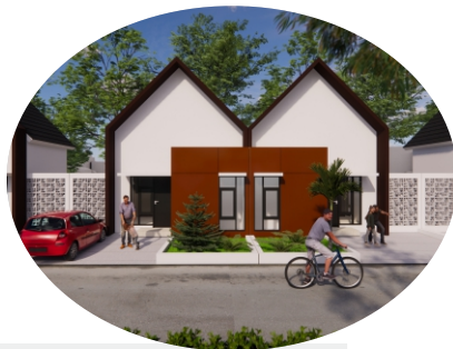
TAMPAK TIPE 30/90