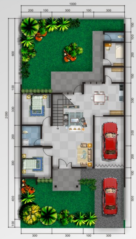
DENAH PENGEMBANGAN 2 LANTAI