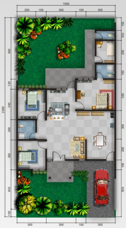
DENAH PENGEMBANGAN 1 LANTAI