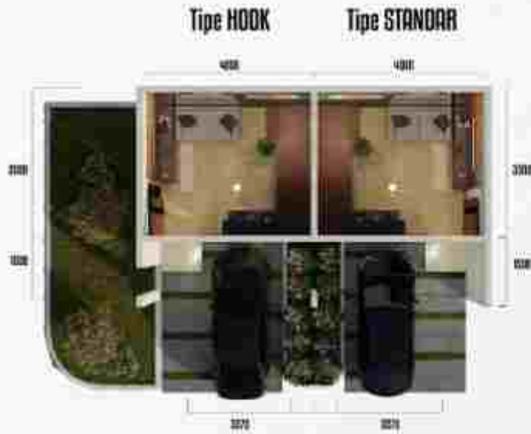
Denah Lantai 1