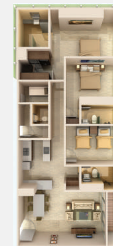
SIGNATURE LEVEL 102 m 2