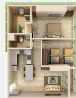
2 BR STANDARD 85 m 2