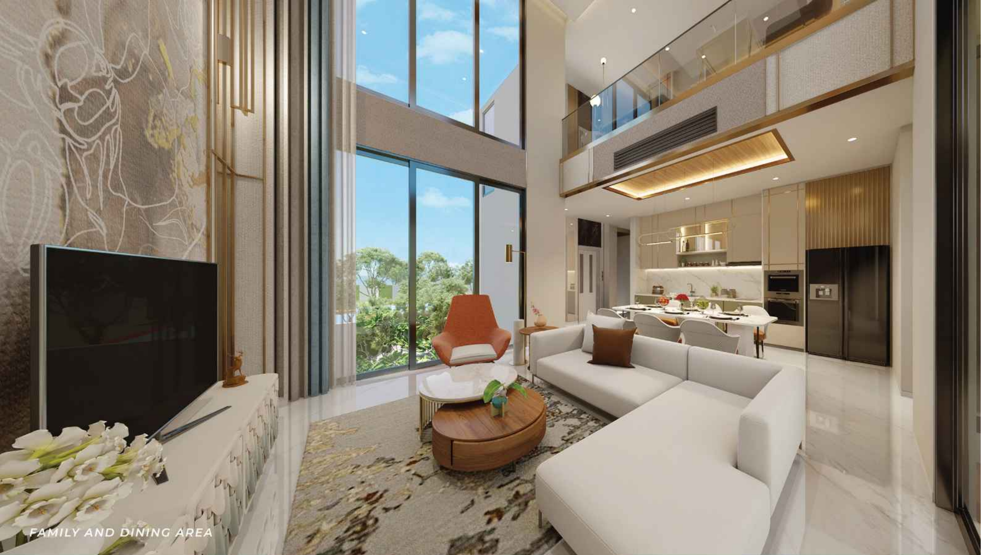
FAMILY AND DINING AREA