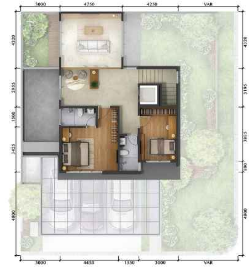
3 rd Floor