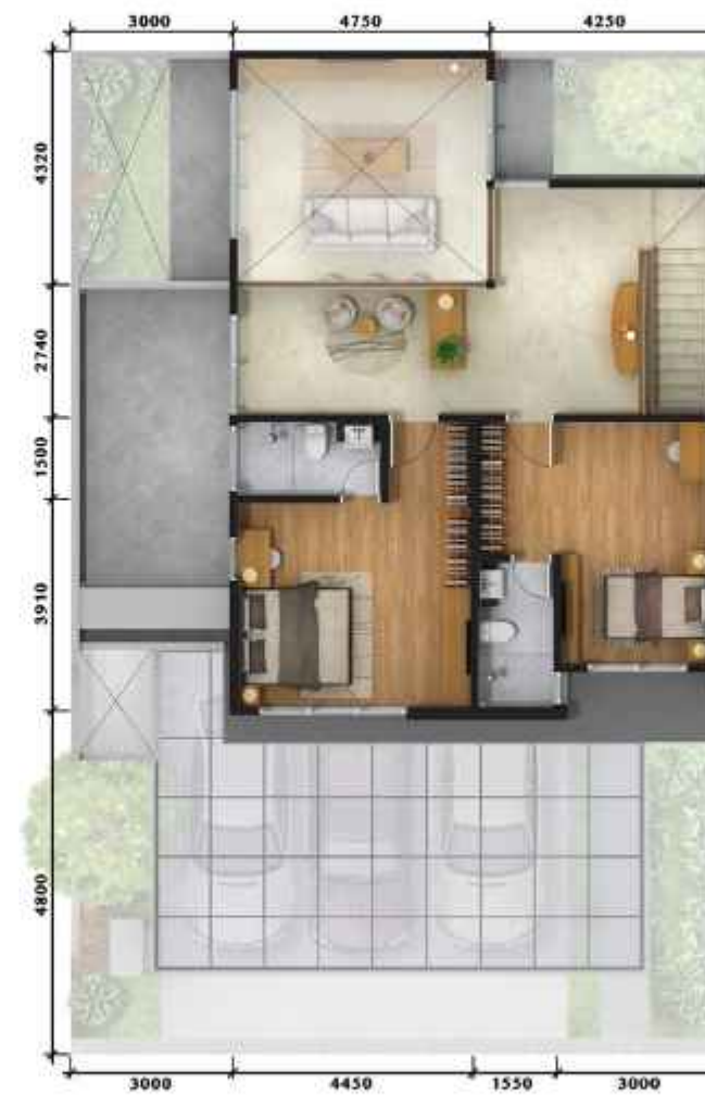
3 rd Floor