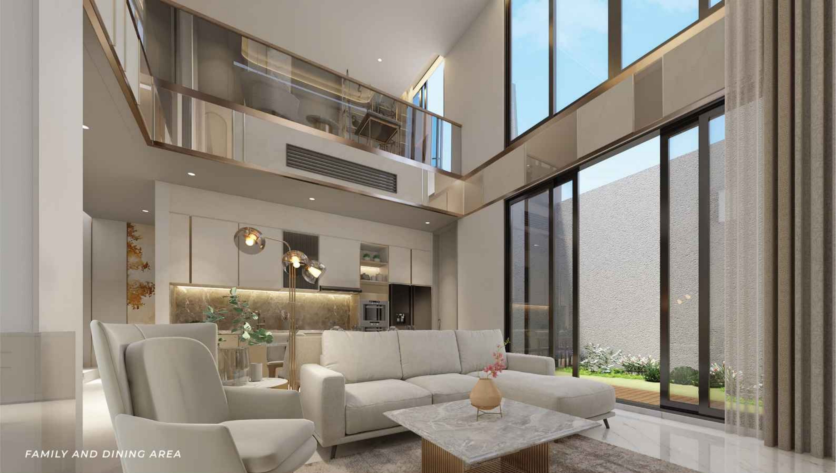
FAMILY AND DINING AREA