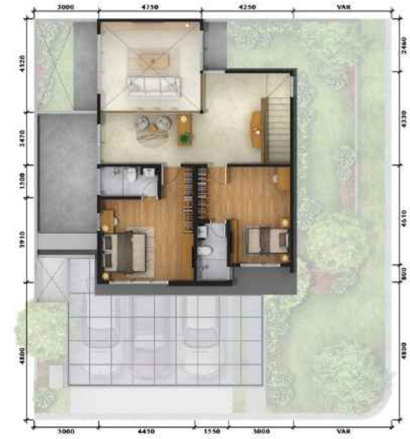
3 rd Floor