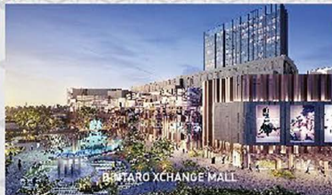
BINTARO XCHANGE WALL