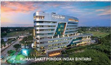
RUMAH SAKIT PONDOK INDAH BINTARO