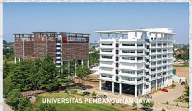
UNIVERSITAS PEMBANGUNAN JAYA