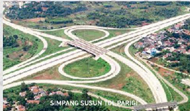
SIMPANG SUSUN TOL PARISI