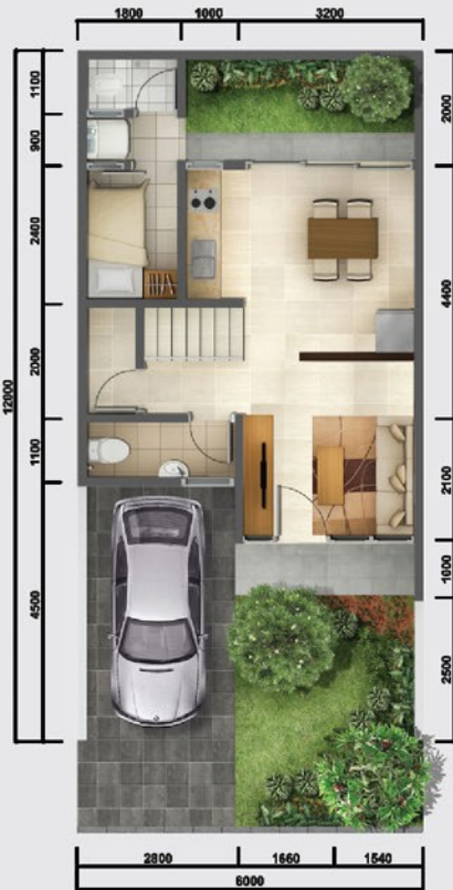
Denah Lantai 1