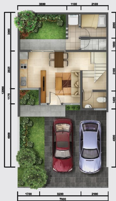
Denah Lantai 1