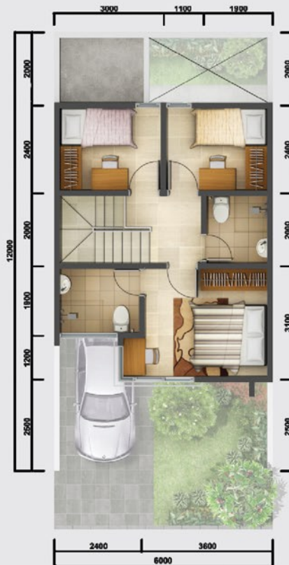
Denah Lantai 2