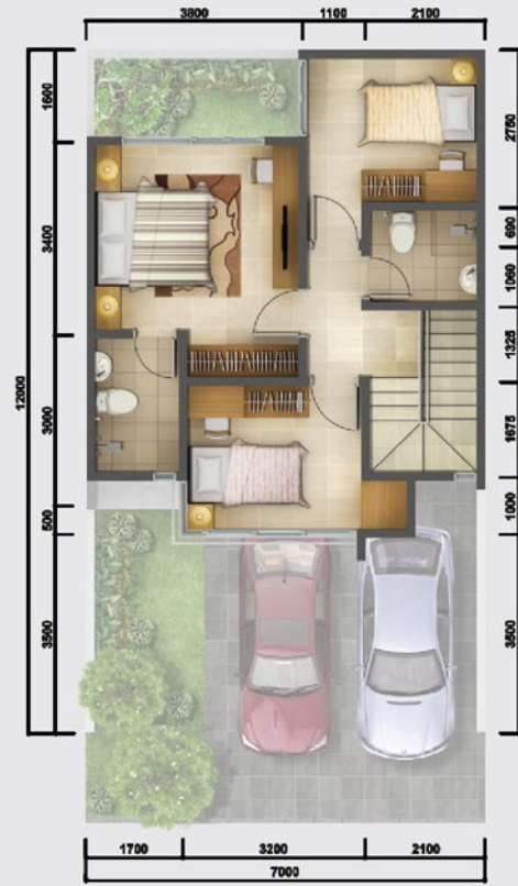
Denah Lantai 2