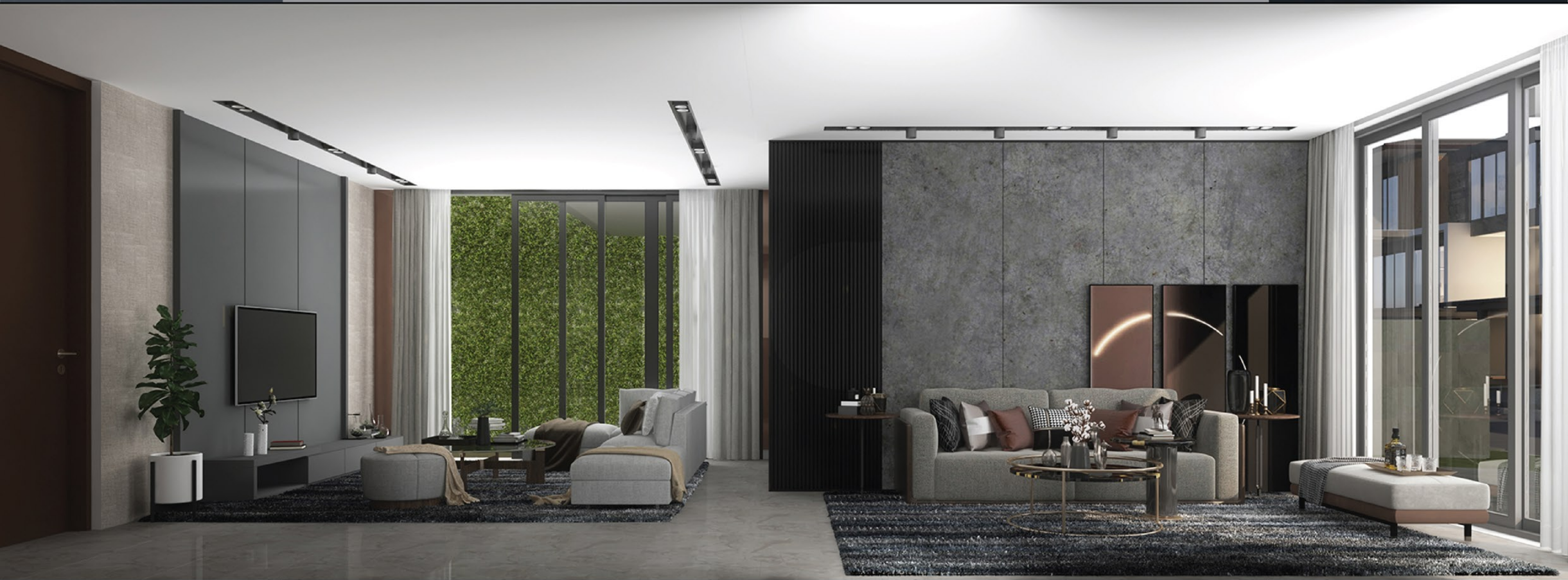
Family and Living Area