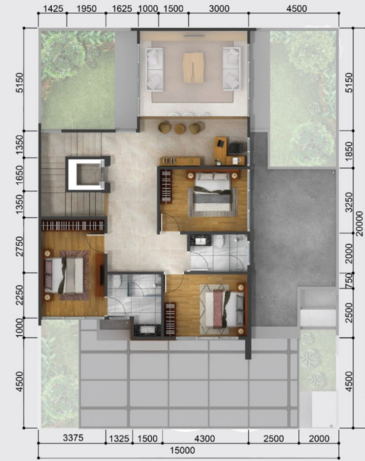
3 rd Floor