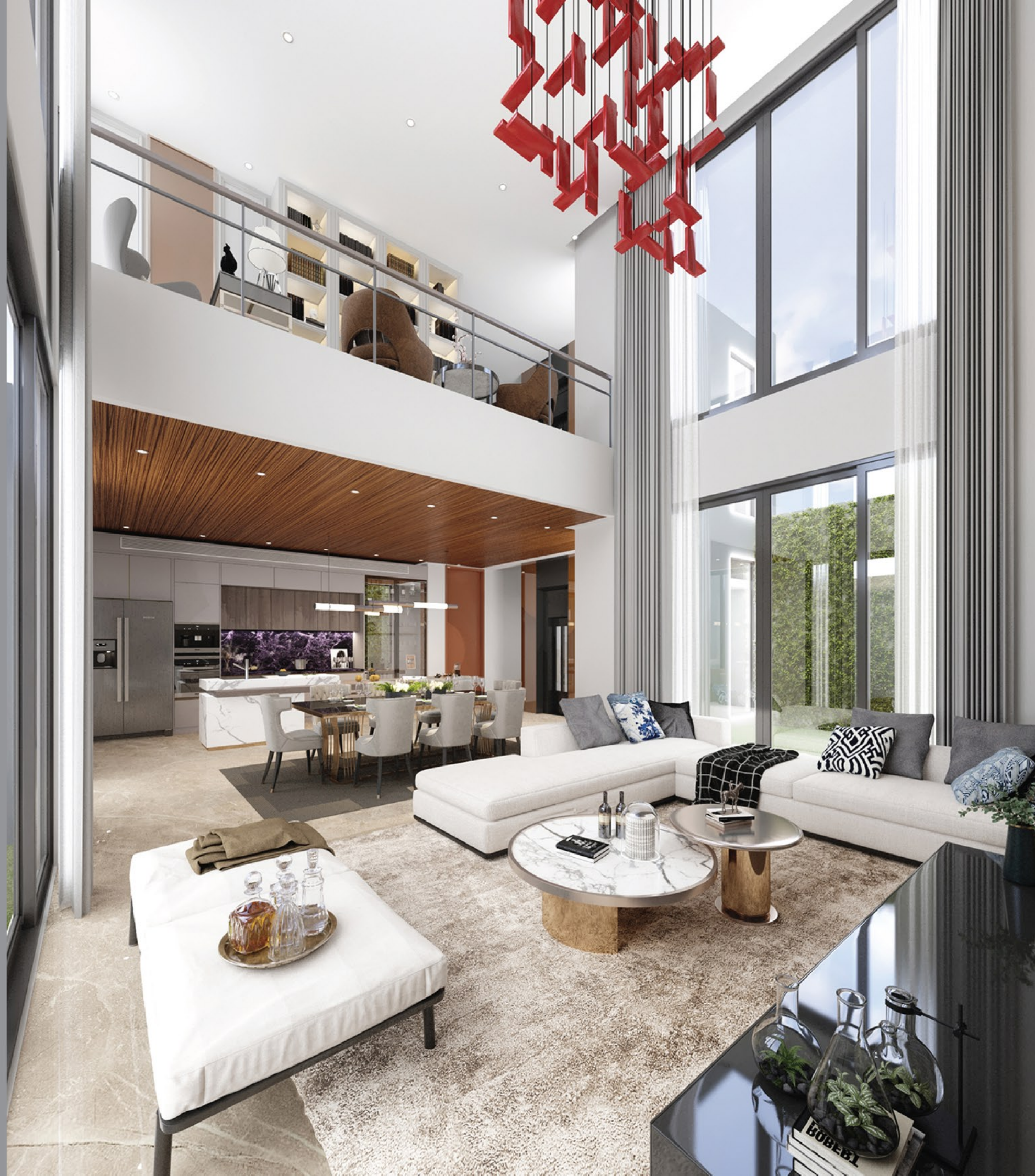
Living and Dining Area