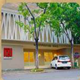
MULTI PURPOSE HALL