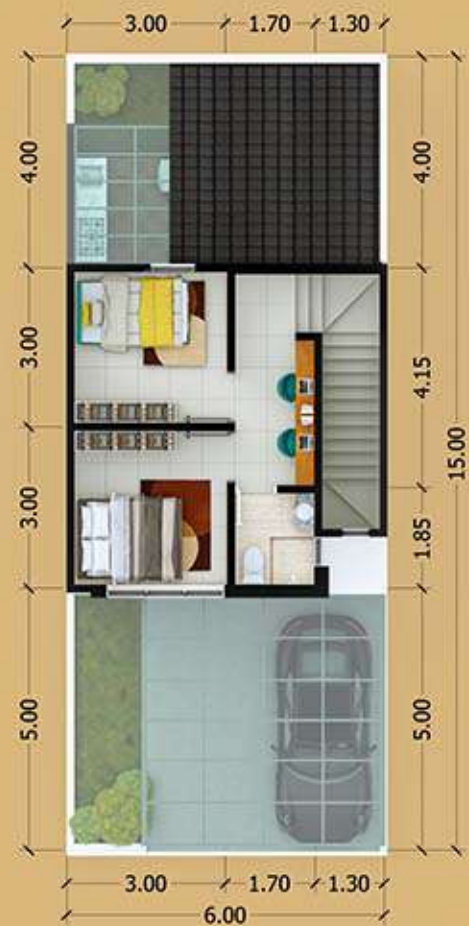
2 st Floor