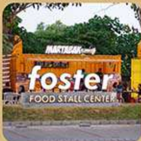
FOOD STALL CENTER