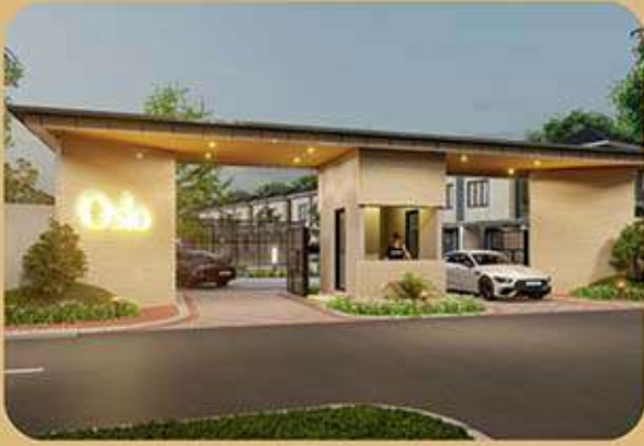
ONE GATE SYSTEM