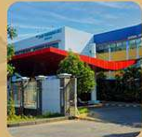
SEKOLAH PEMBANGUNAN JAYA