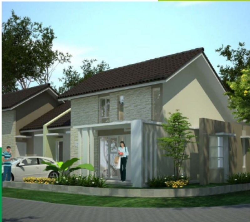
CASTILLO SUDUT Tipe 88