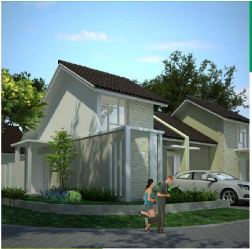
CAMINO SUDUT Tipe 44