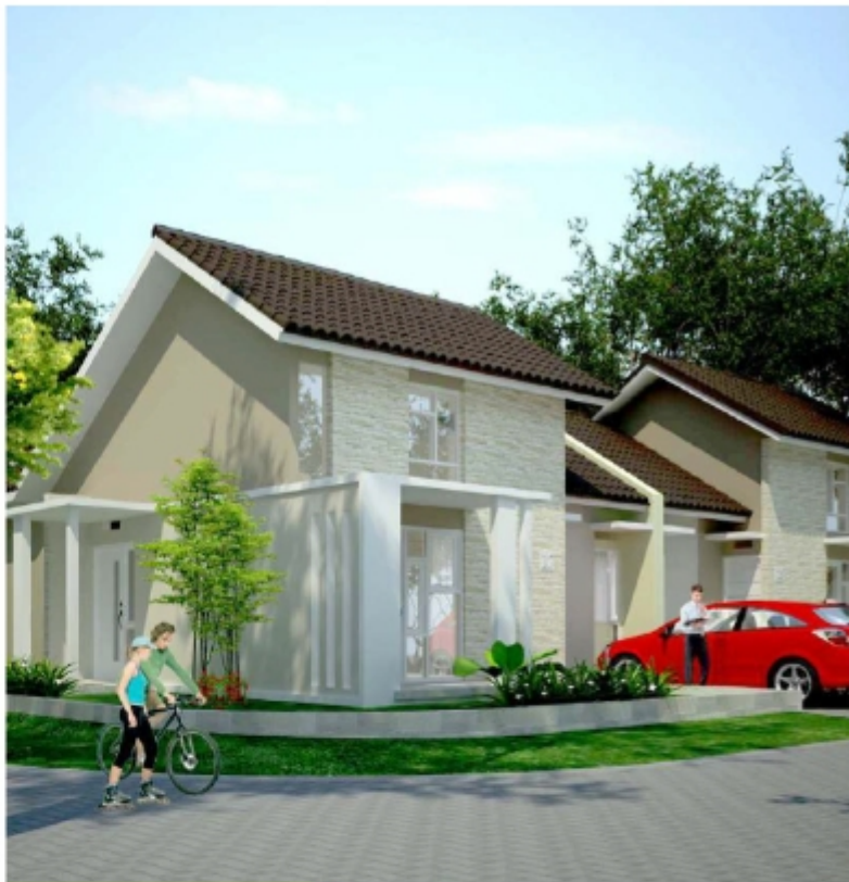
MONTESA SUDUT Tipe 73