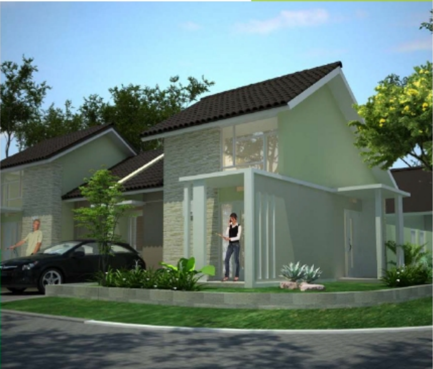
MADLAINE SUDUT Tipe 55