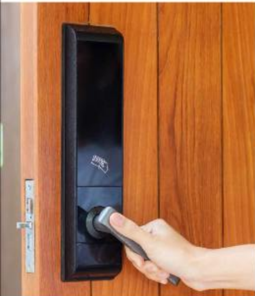
Smart Door Lock*