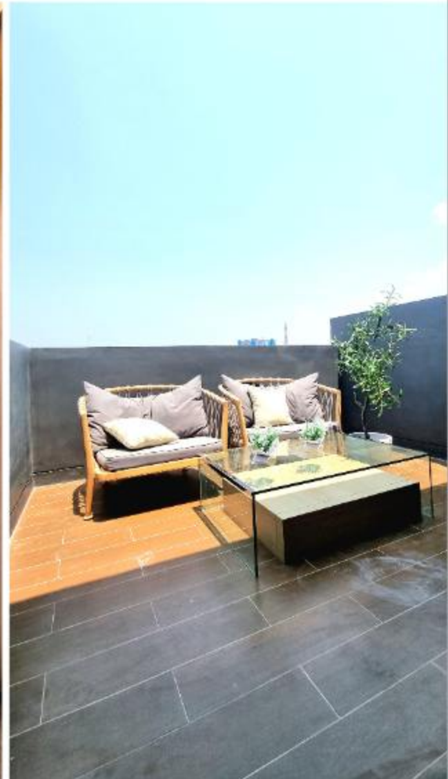
Show Unit Costaria