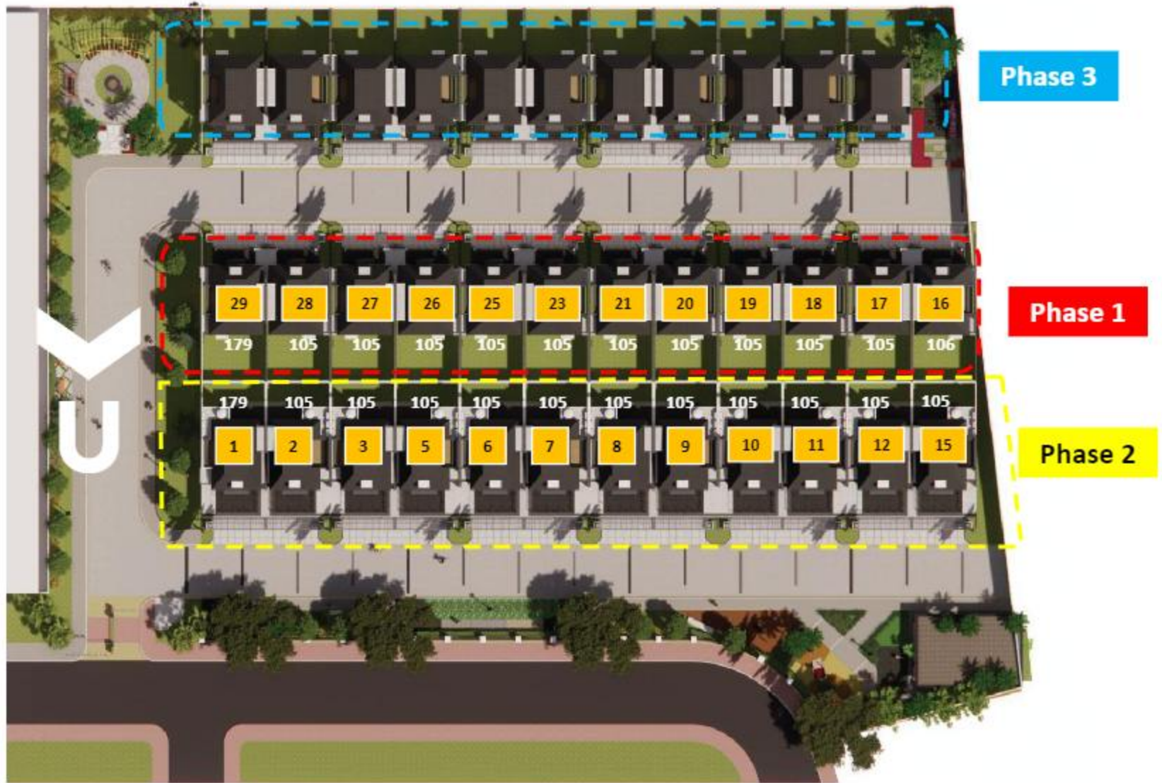
Block plan Costaria