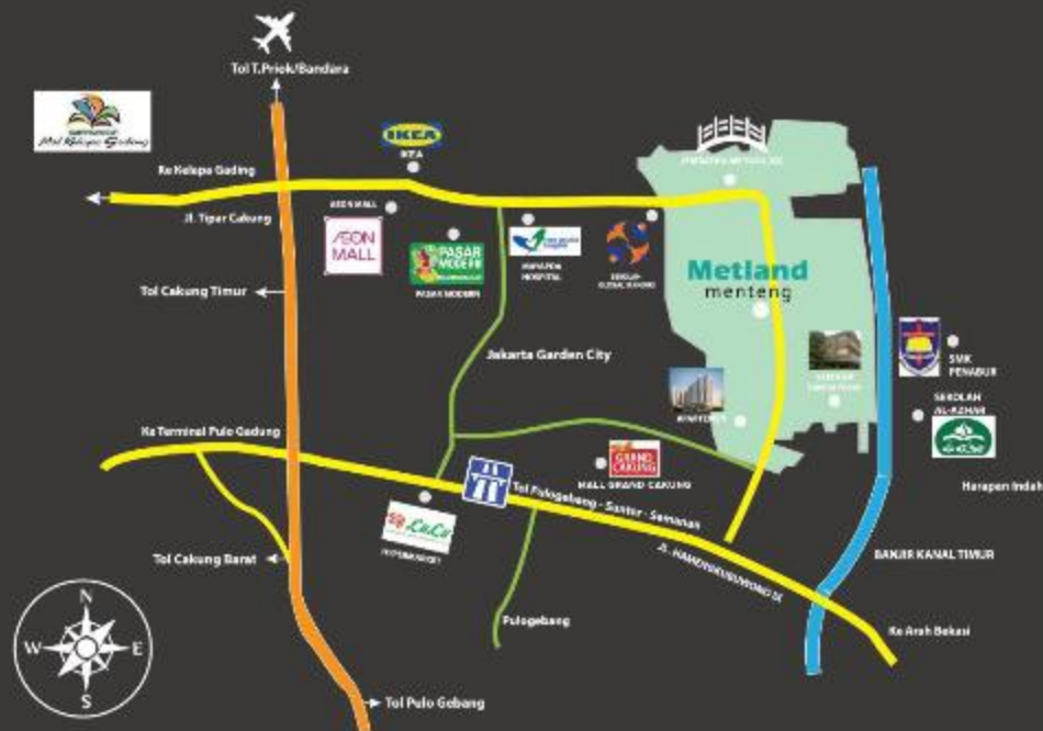
Destinasi di Sekitar Kawasan