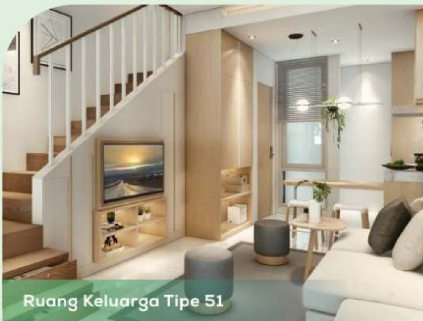
Ruang Keluarga Tipe 51