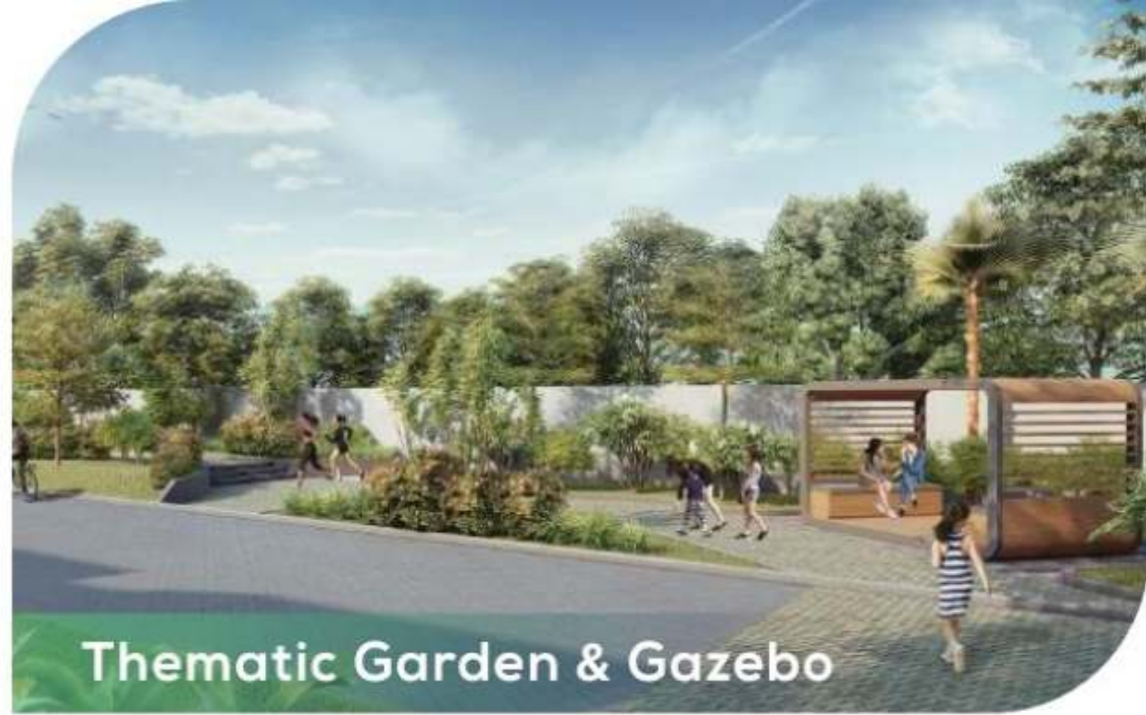
Thematic Garden & Gazebo