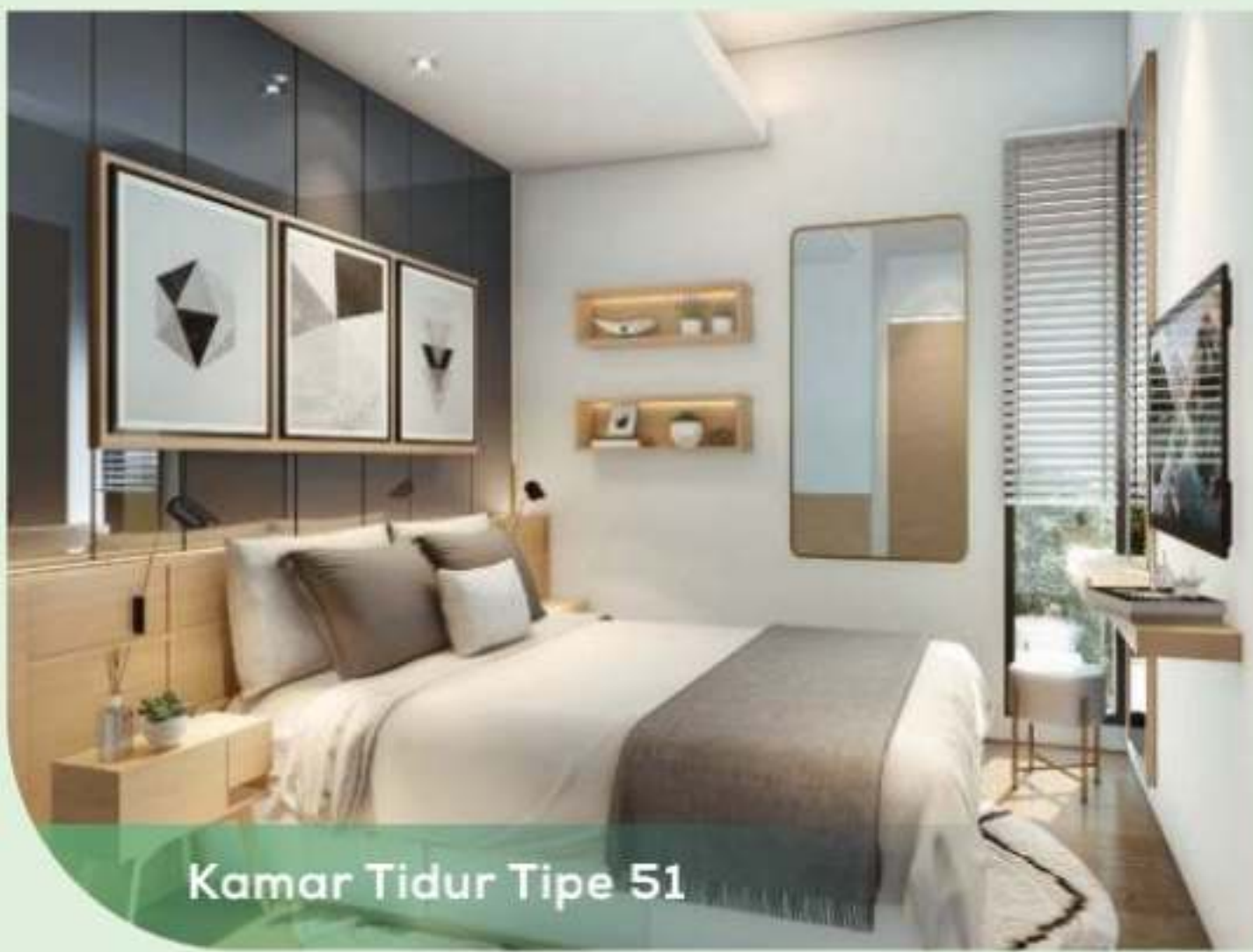
Kamar Tidur Tipe 51