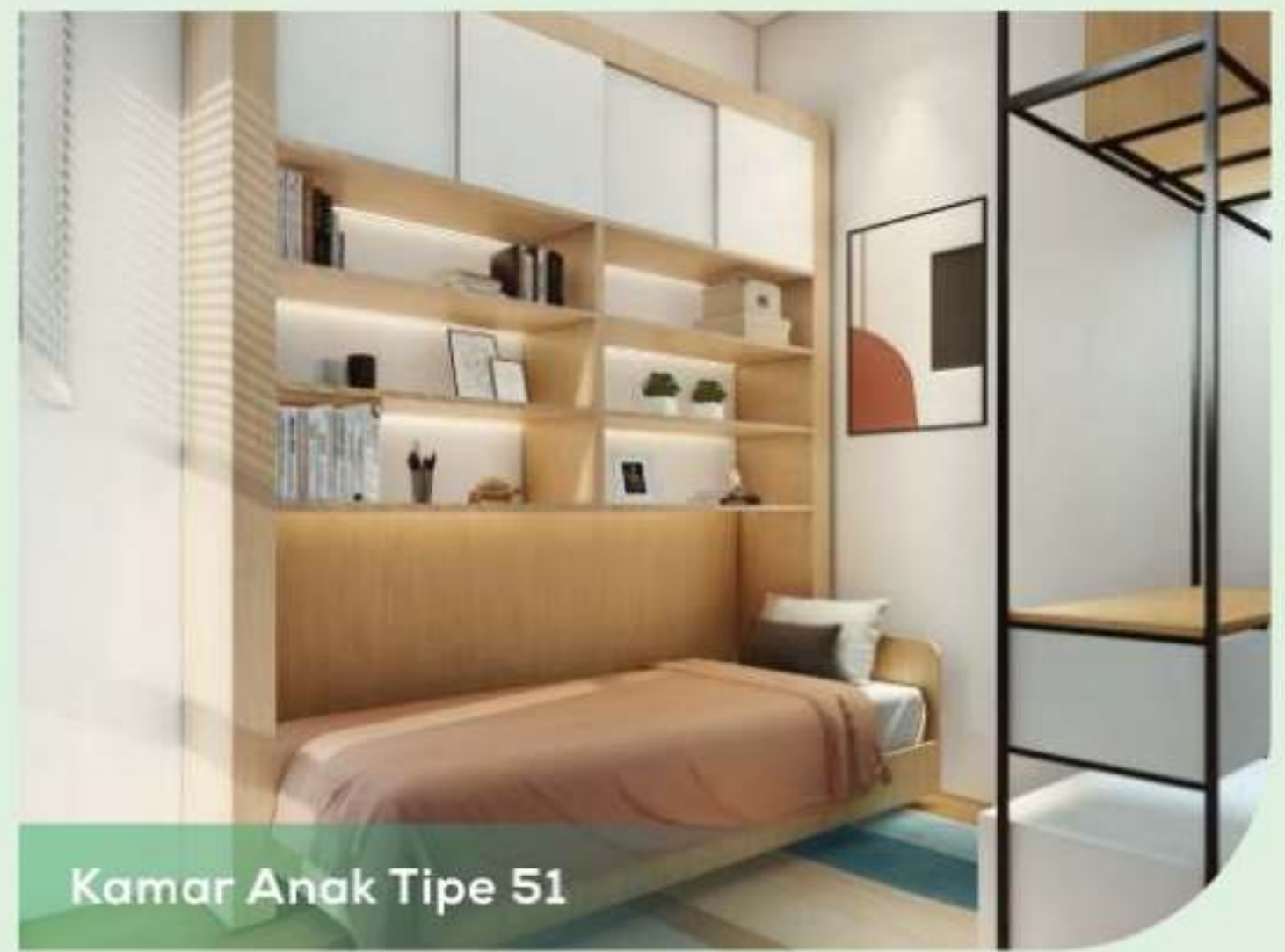
Kamar Anak Tipe 51