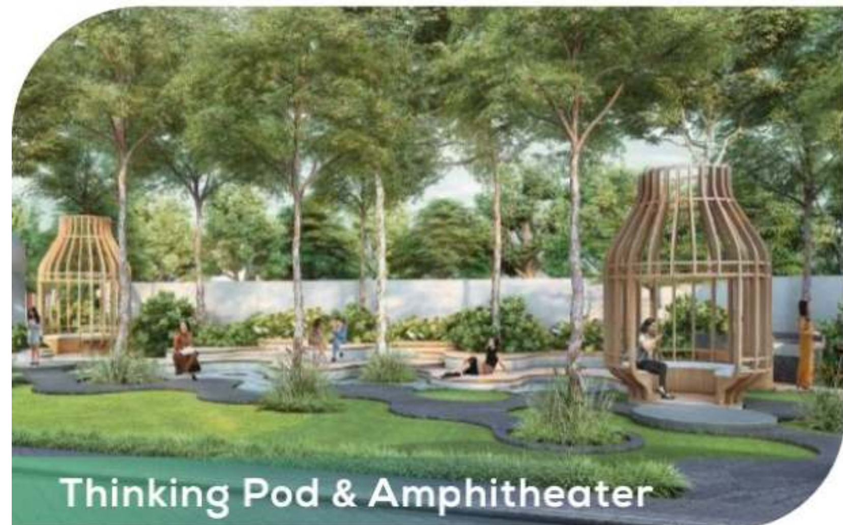
Thinking Pod & Amphitheater