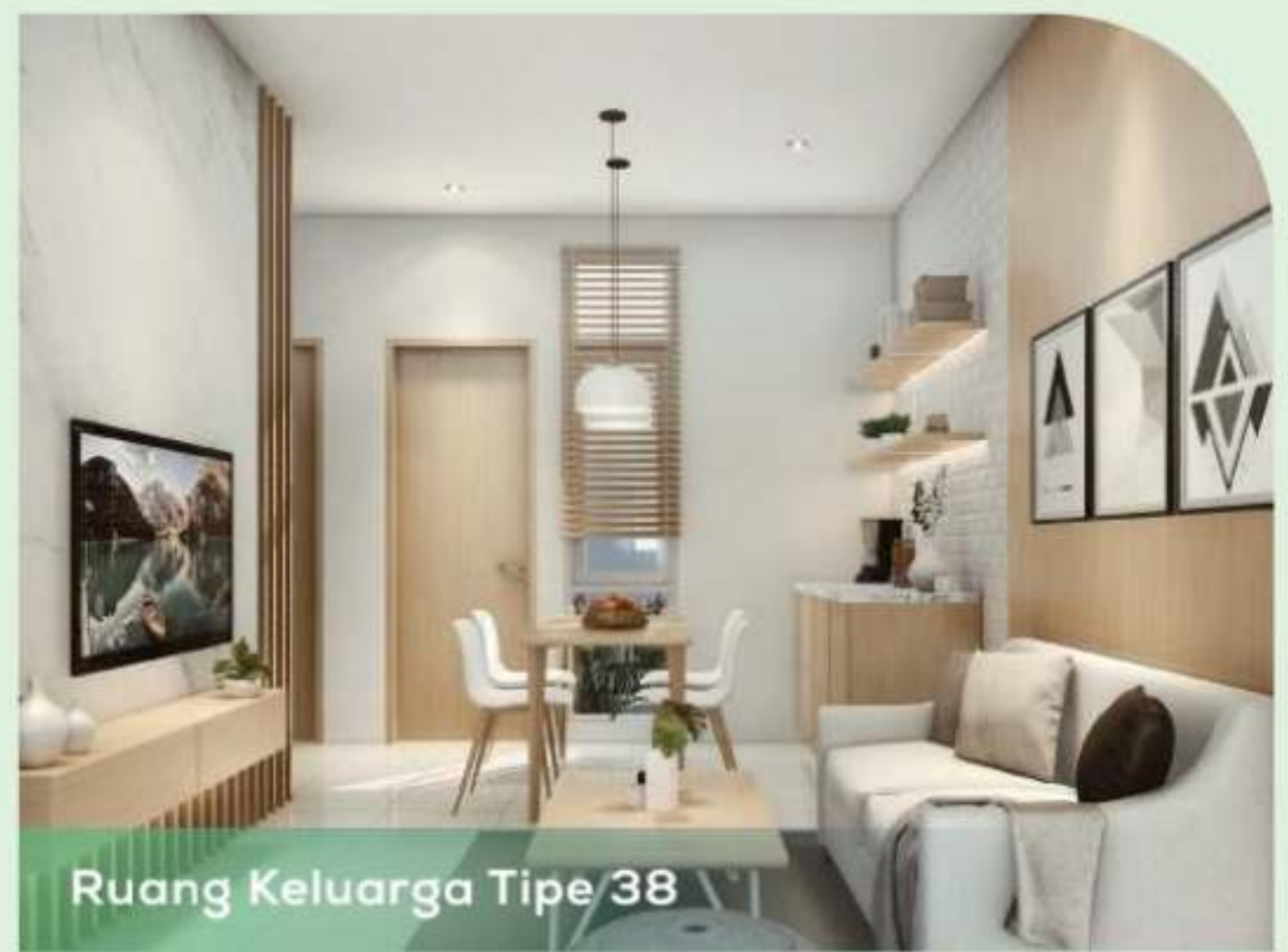
Ruang Keluarga Tipe 38