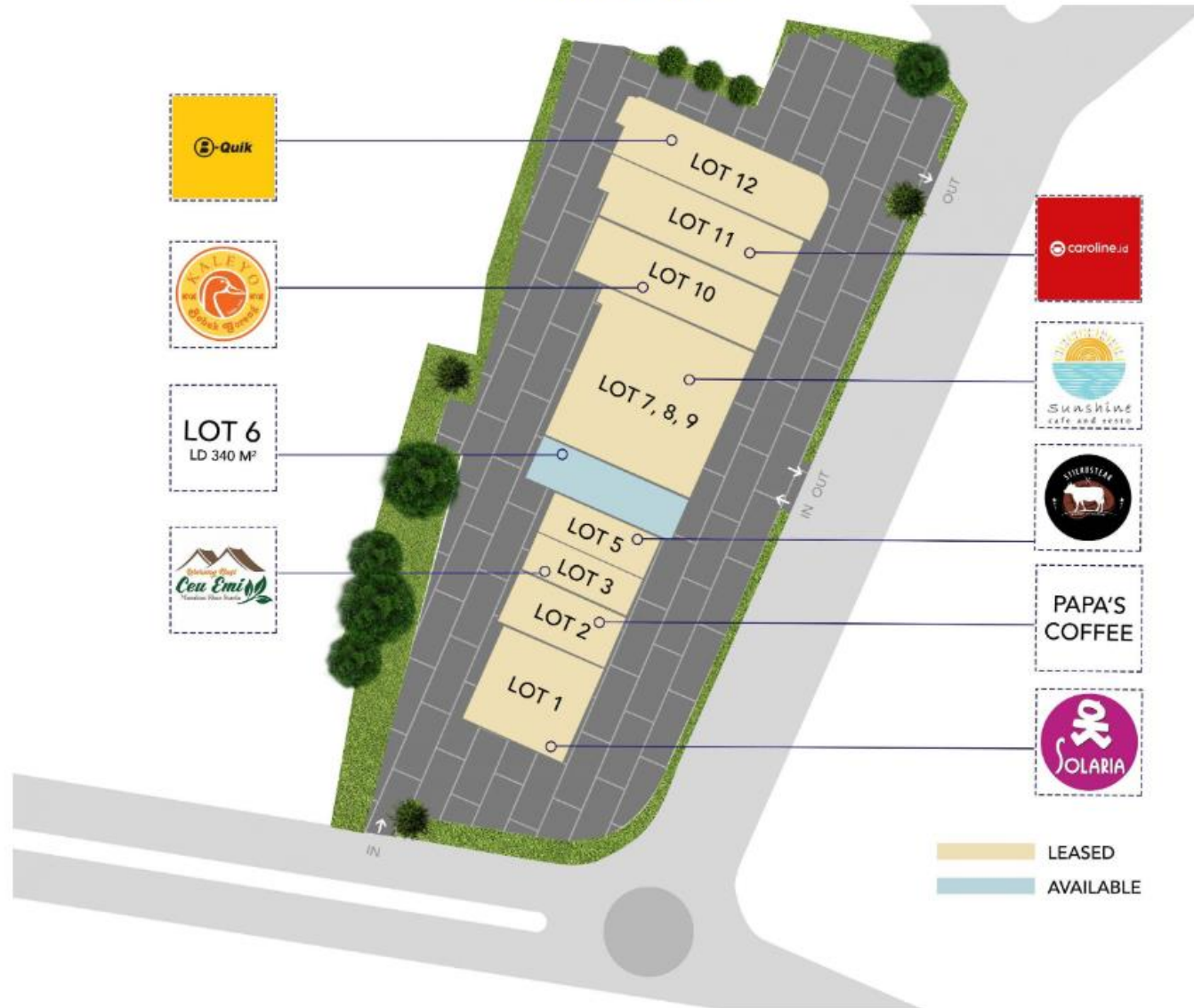
SouthCity Hive 1