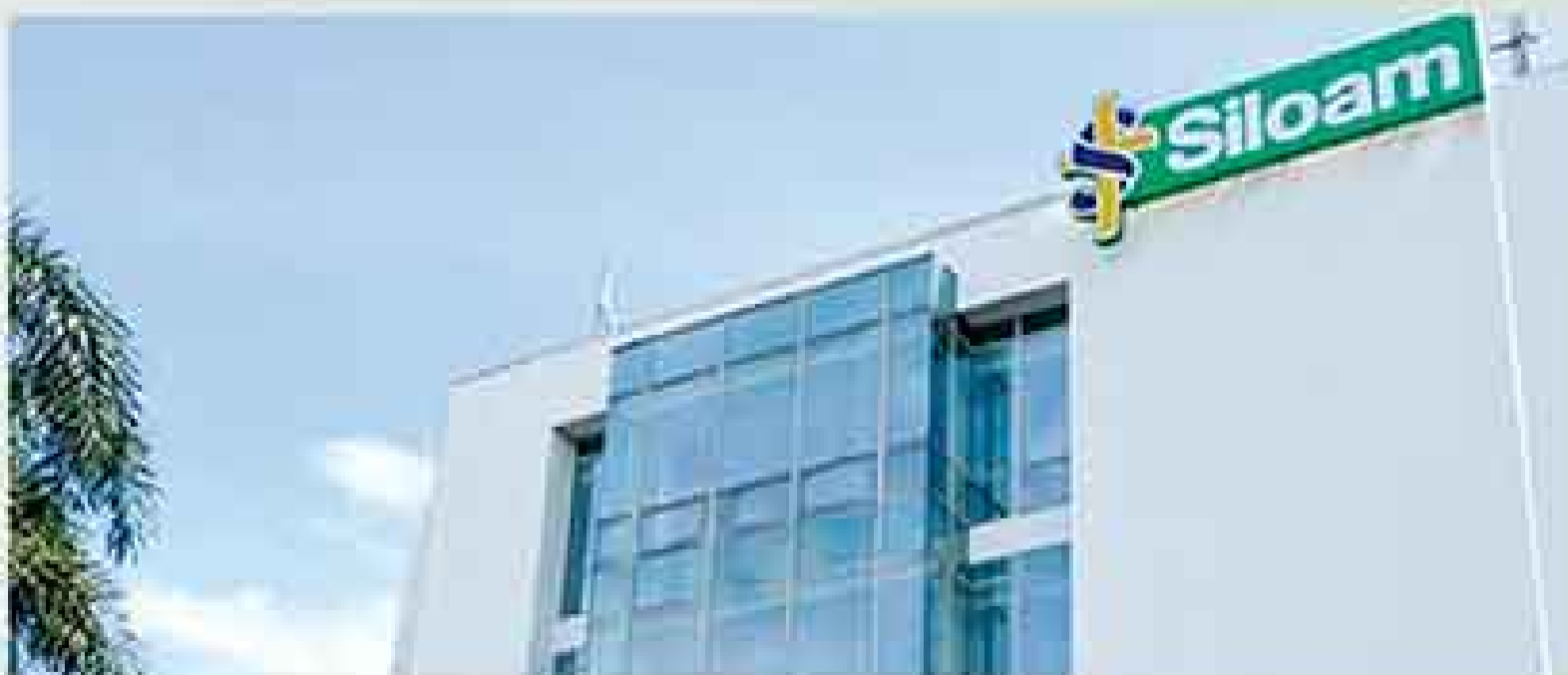
5 menit menuju Siloam Hospital