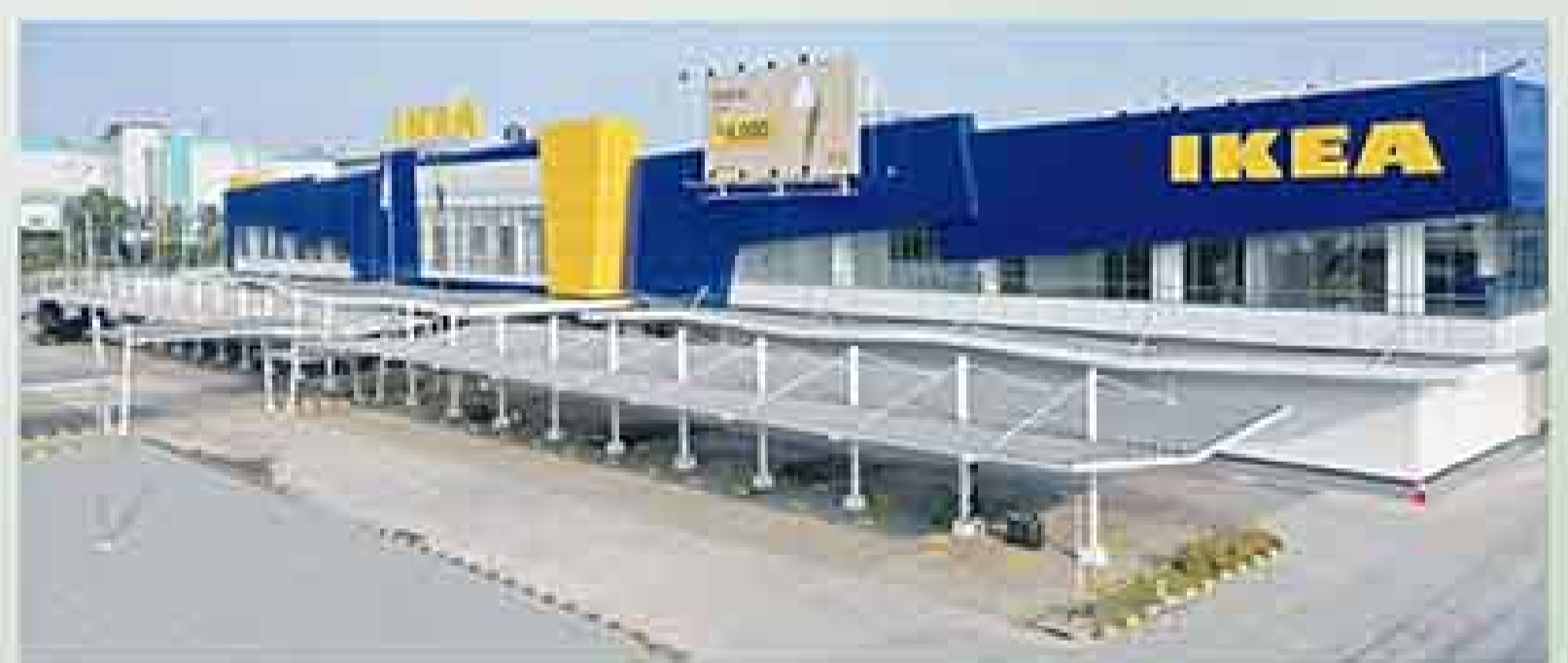
5 menit menuju IKEA Sentul