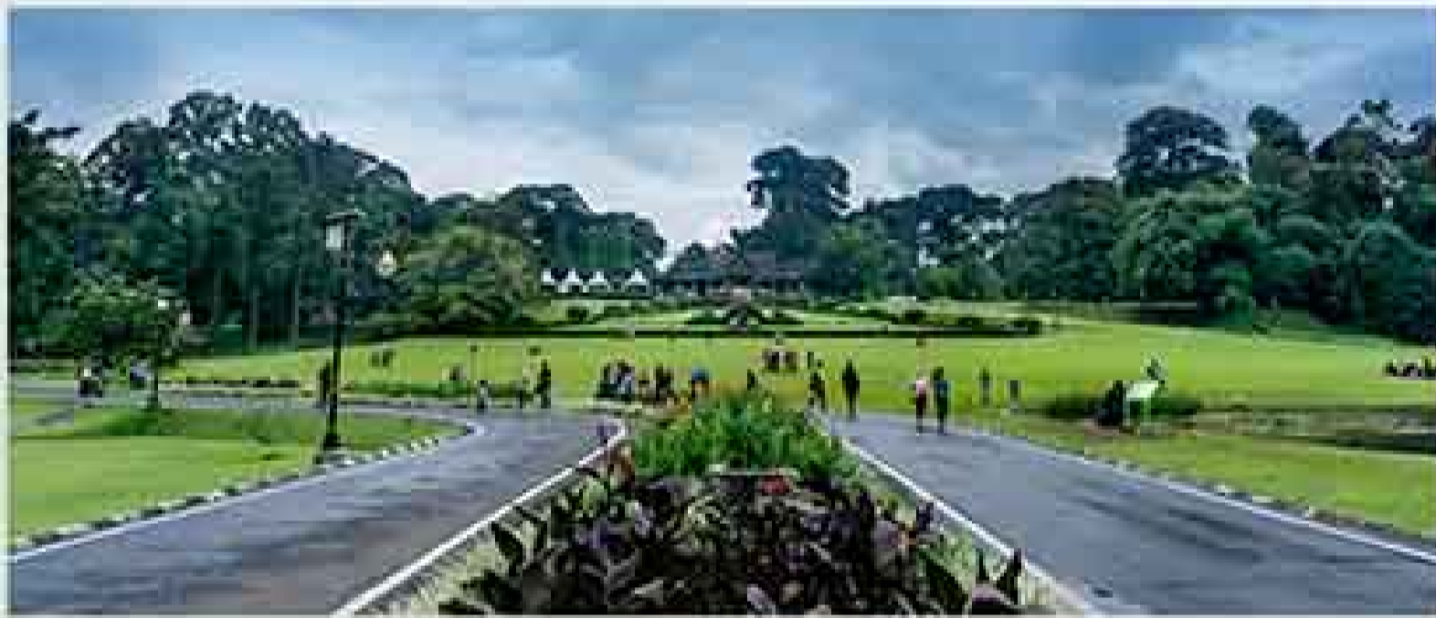
10 menit menuju Kebun Raya Bogor