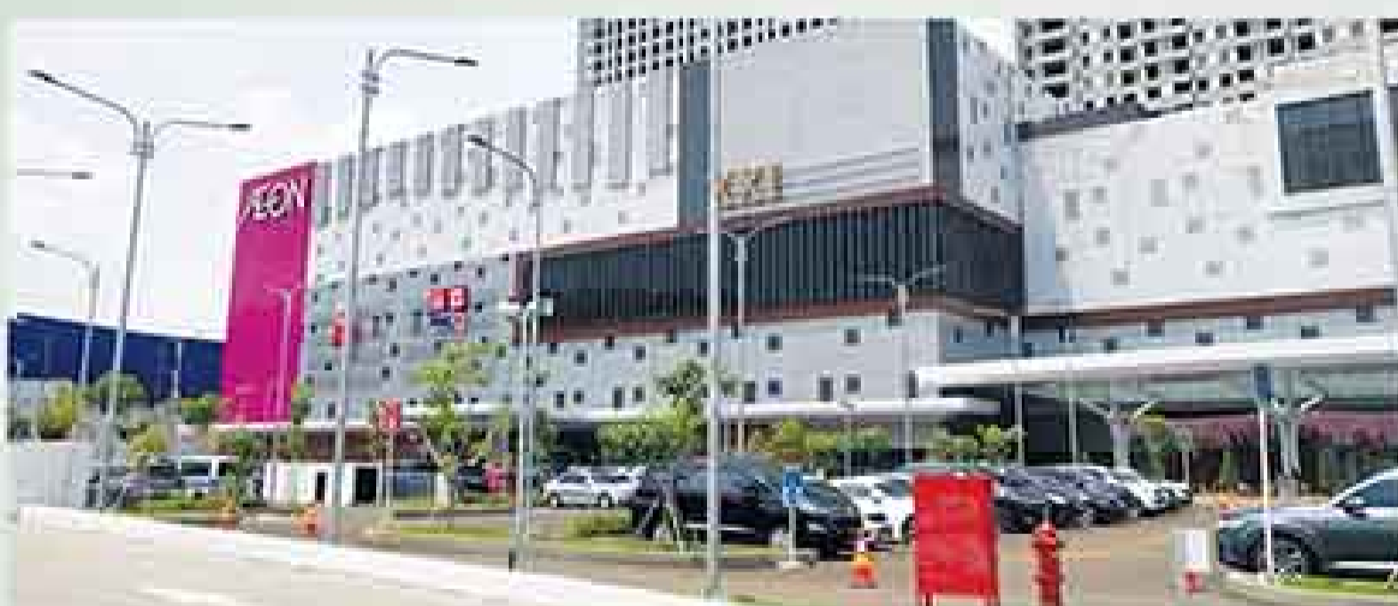
5 menit menuju Aeon Mall