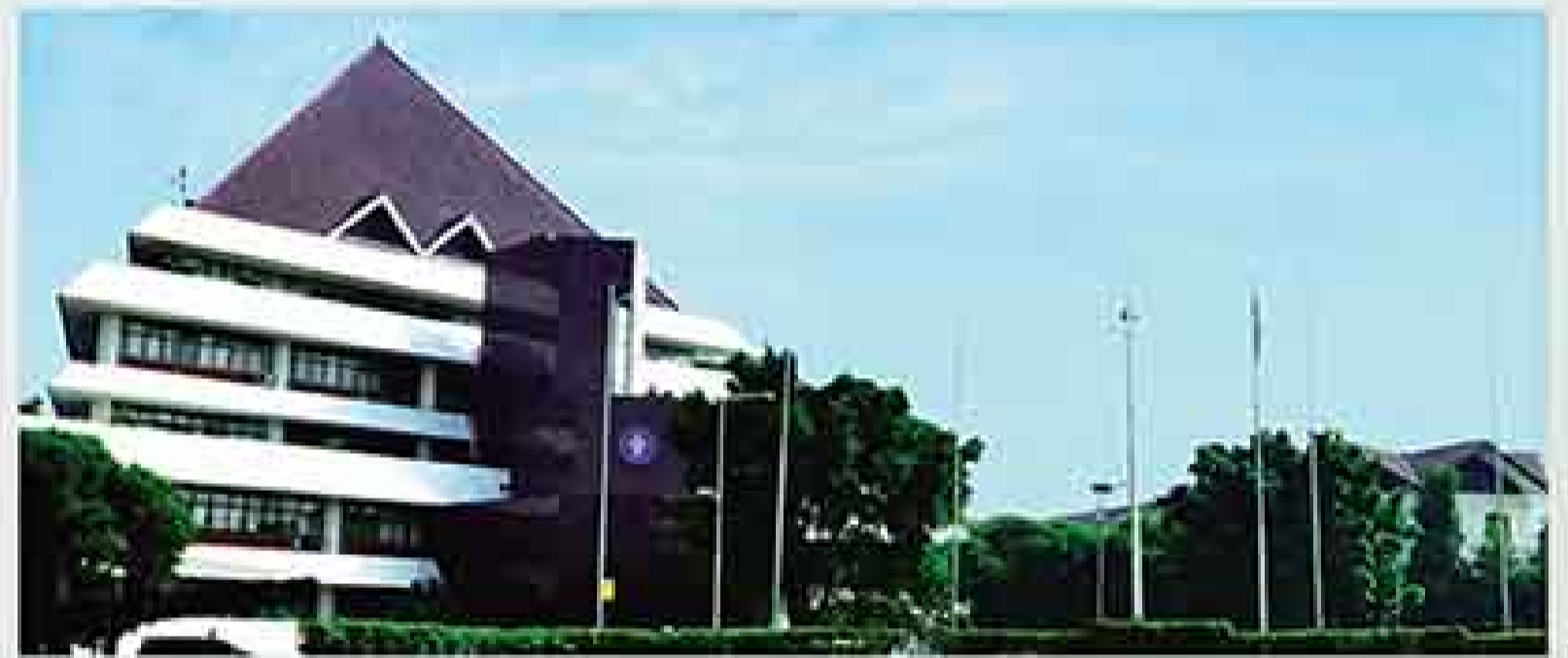
10 menit menuju IPB University