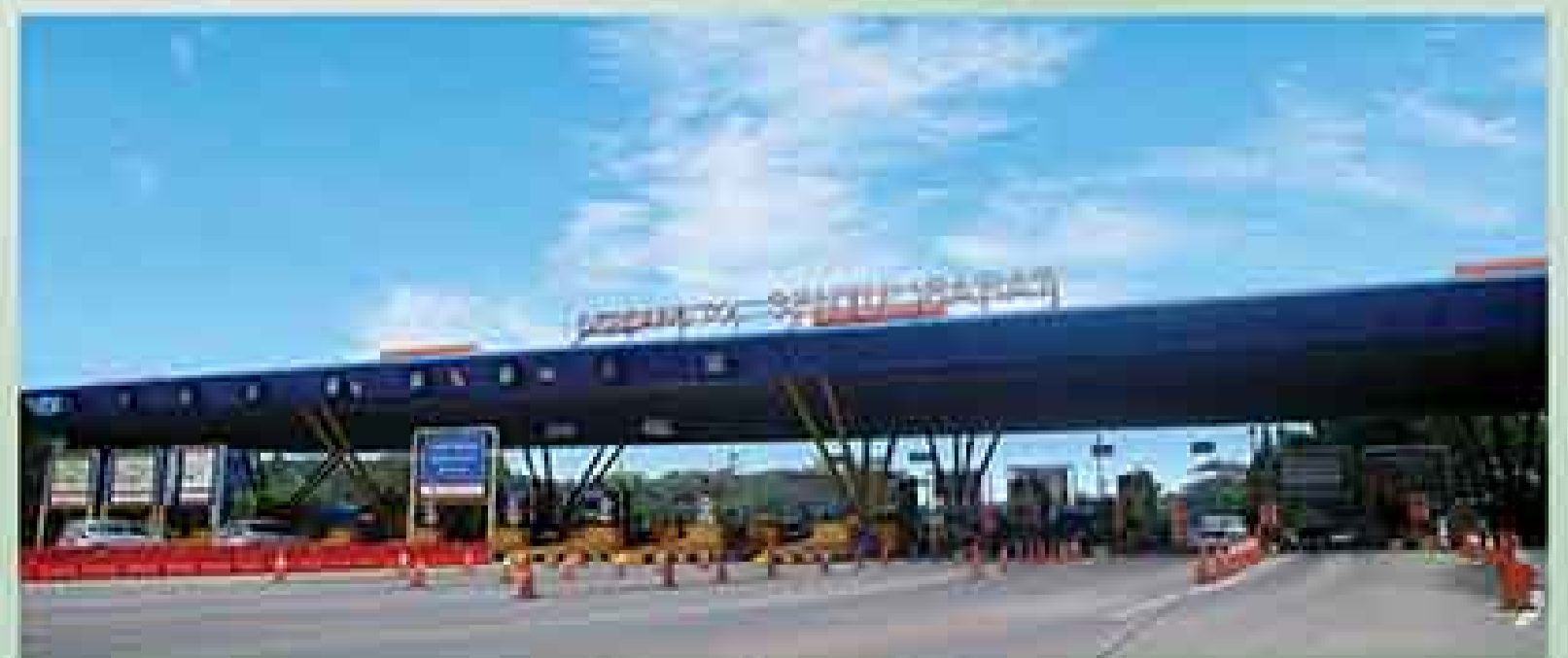
0 km TOLL BORR