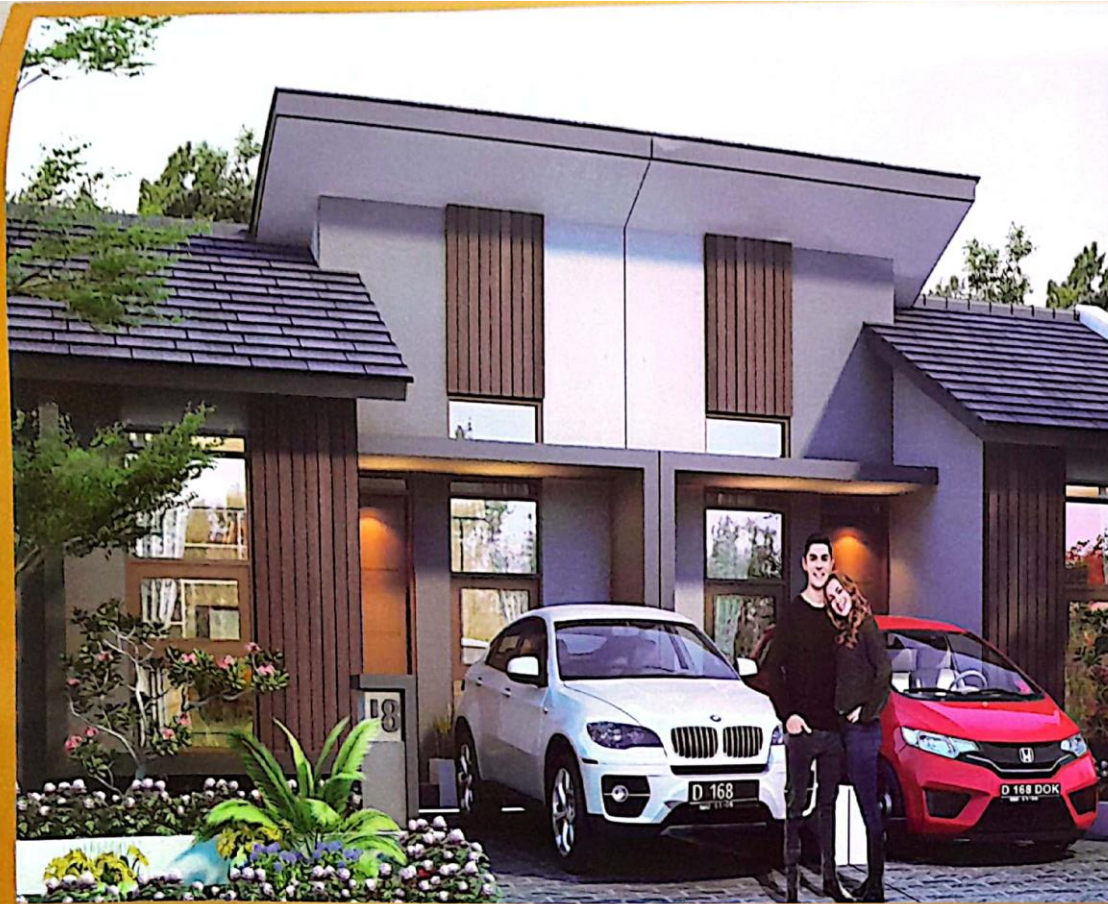
TYPE RUMAH TAMAN