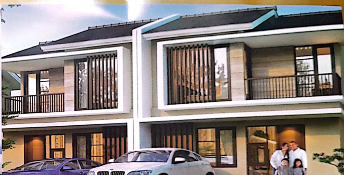
TYPE MODERN BALI