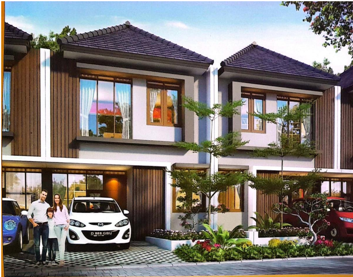
TYPE GARDEN BALI