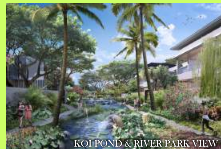
KOI POND & RIVER PARK VIEW