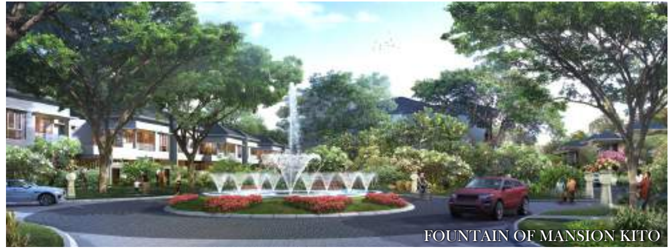
FOUNTAIN OF MANSION KITO

MANSION KITO ® "HUNIAN MEWAH BERNUANSA RESORT"