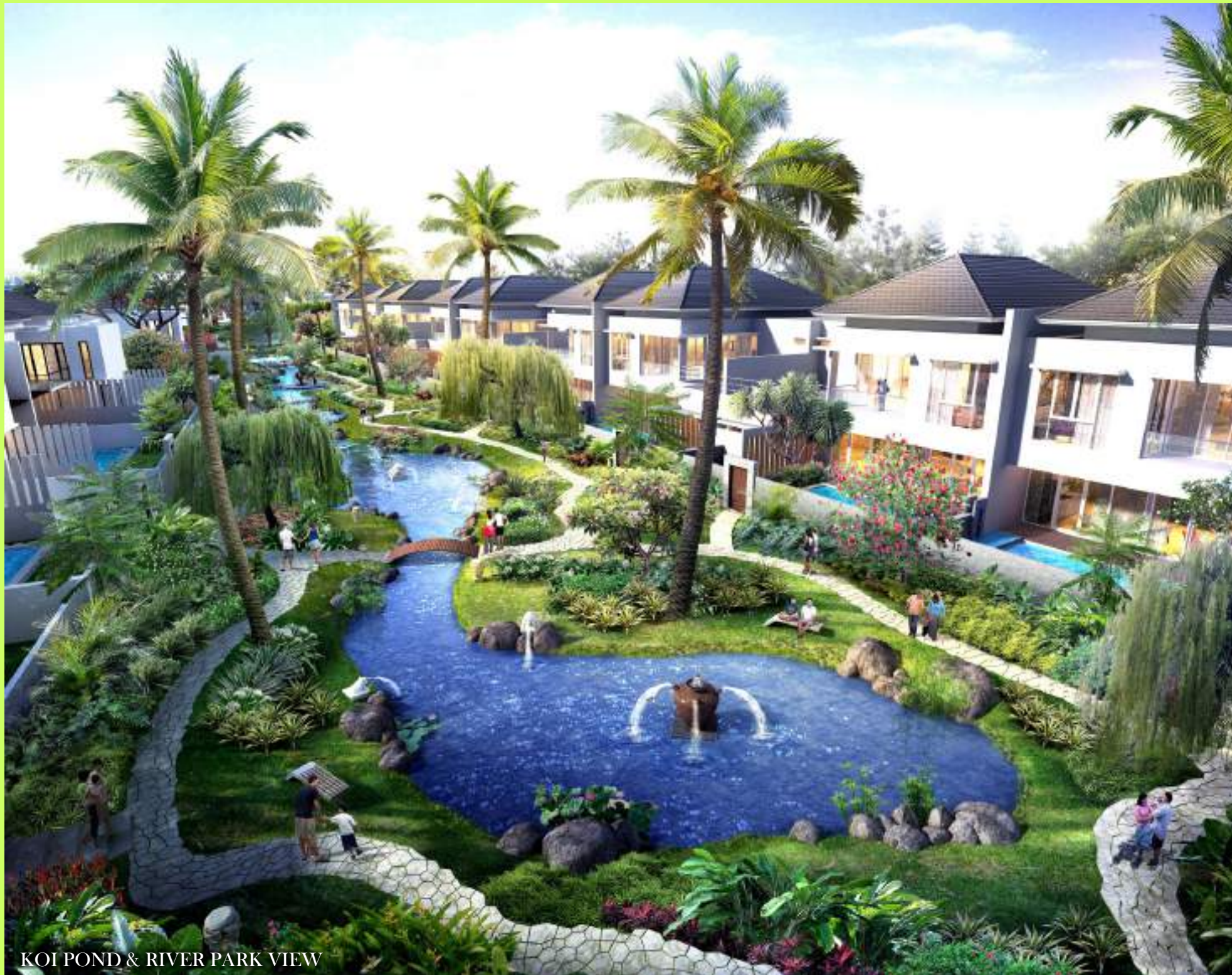
KOI POND & RIVER PARK VIEW

Dengan pengalaman lebih dari 20 tahun, PT. PUTRA SENTOSA PRAKARSA telah menjadi ' pioneer ' dengan reputasi terpercaya dalam bidang properti di Jambi.