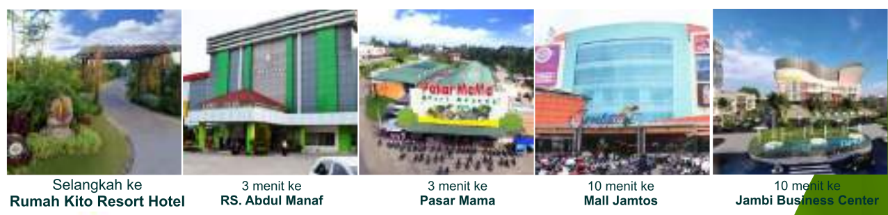
Selangkah ke Rumah Kito Resort Hotel 3 menit ke RS. Abdul Manaf 3 menit ke Pasar Mama 10 menit ke Mall Jamtos 10 menit ke Jambi Business Center