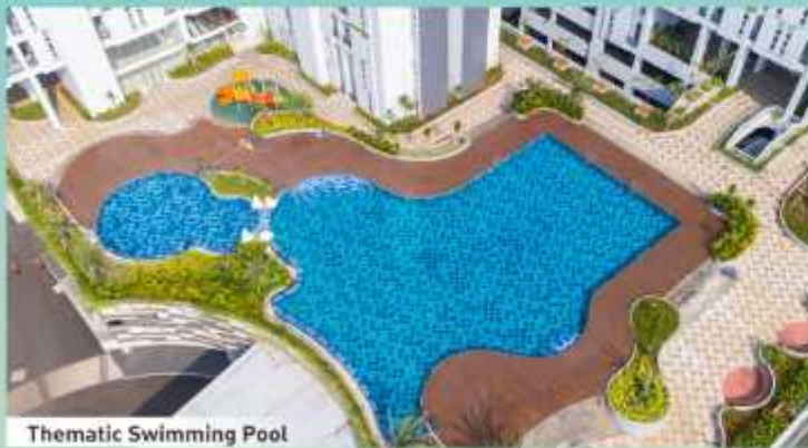
Thematic Swimming Pool