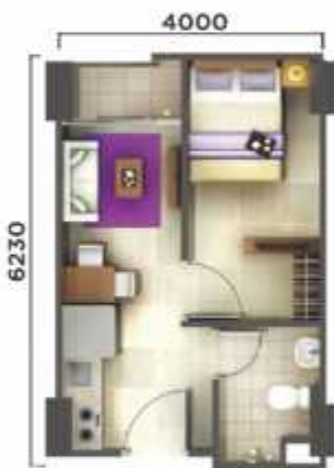
1 BEDROOM A

Semi Gross : 29.96 m Nett Area : 24.23 m