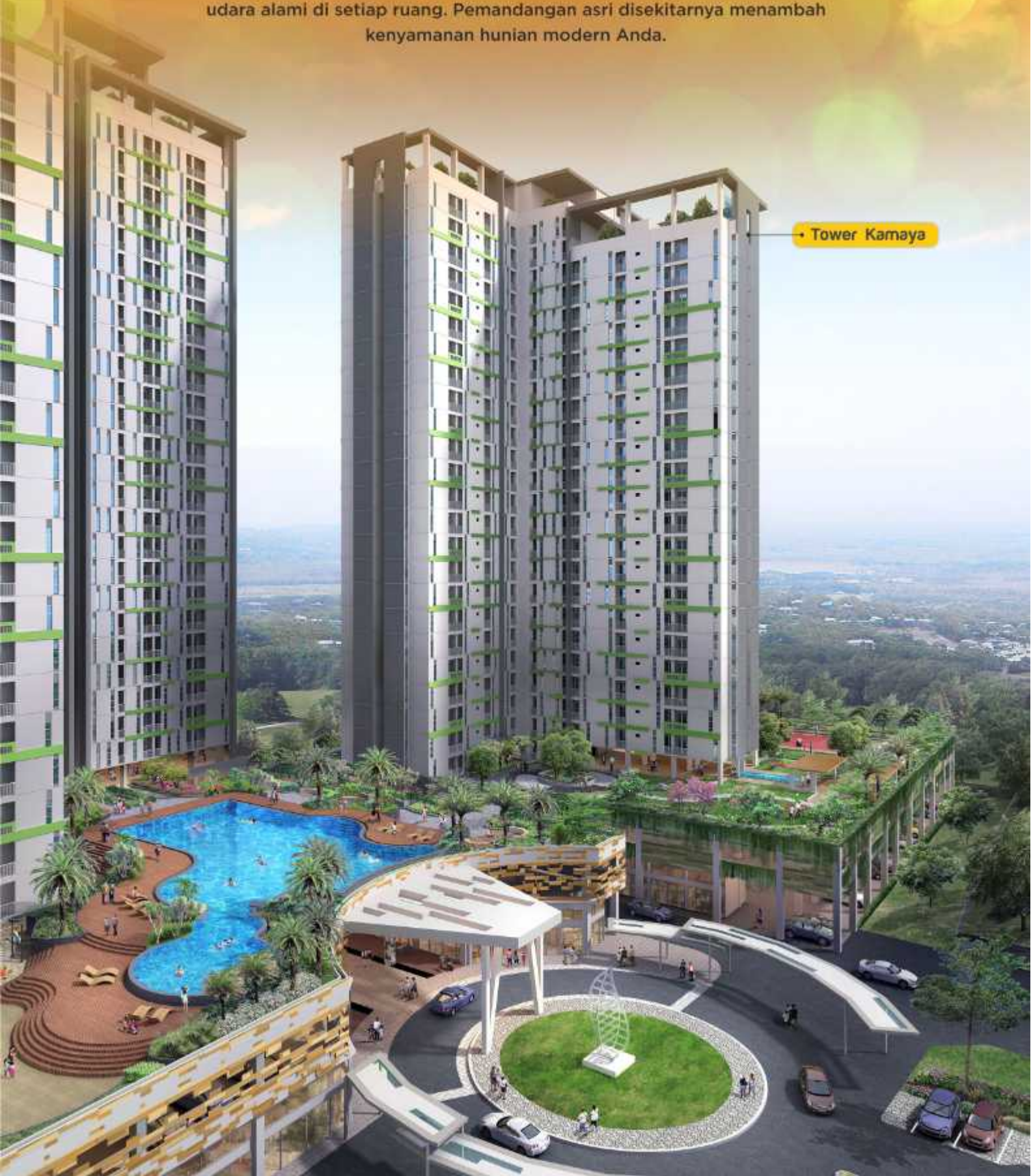
• Tower Kamaya

Setiap unitnya dirancang memiliki balkon yang menghasilkan ventilasi udara alami di setiap ruang. Pemandangan asri disekitarnya menambah kenyamanan hunian modern Anda.