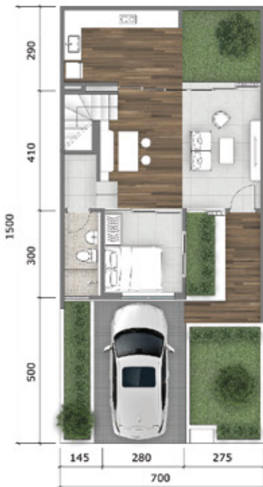
Denah Lantai 1