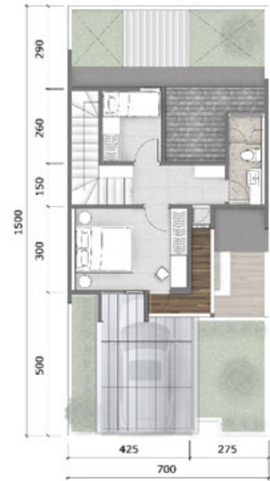
Denah Lantai 2