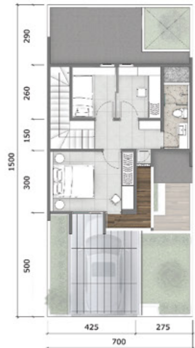
Denah Lantai 2