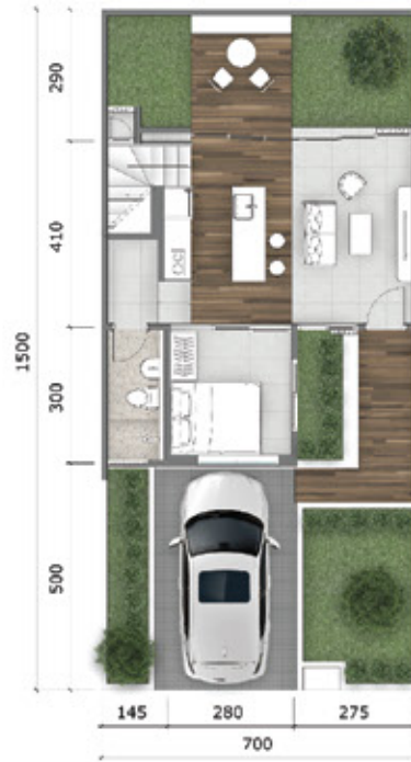
Denah Lantai 1