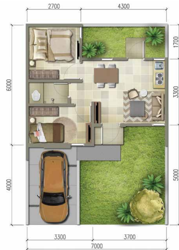
BASIC LT. 70m 2 / LB. 35m 2