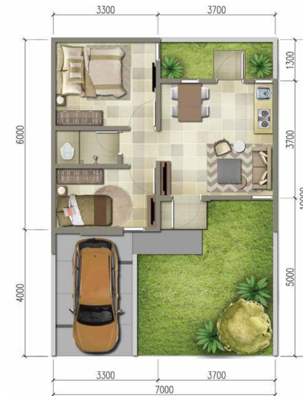
DELUXE LT. 70m 2 / LB. 38m 2