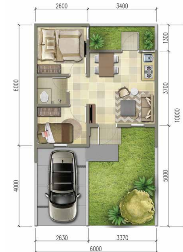
DELUXE LT. 60m 2 / LB. 33m 2