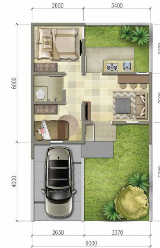
BASIC LT. 60m 2 / LB. 30m 2