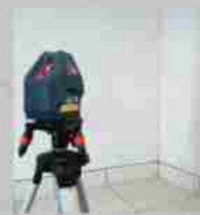
Pengecekan kualitas verticality dinding dengan laserline

Dengan penerapan Summarecon Quality Improvement Initiative (SQII) maka dihasilkan produk hunian yang lebih prima, berkualitas terbaik sehingga konsumen percaya menjadi nyaman untuk tinggal maupun berinvestasi.