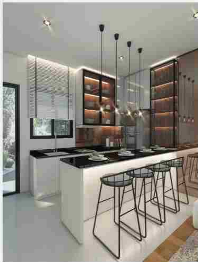
SHOW UNIT PLUM L7 PREMIUM