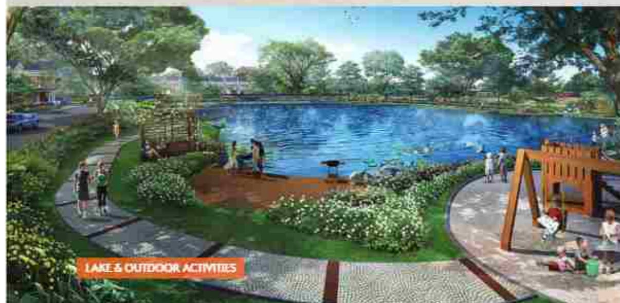
LAKE & OUTDOOR ACTIVITIES

di alam yang asri nan hijau, dikelilingi indahnya danau, dan dilengkapi area komersil dengan fasilitas publik yang terpadu. Berlokasi di sisi utara Summarecon Bekasi dan hanya berjarak 600 meter dari pintu II Summarecon Bekasi.