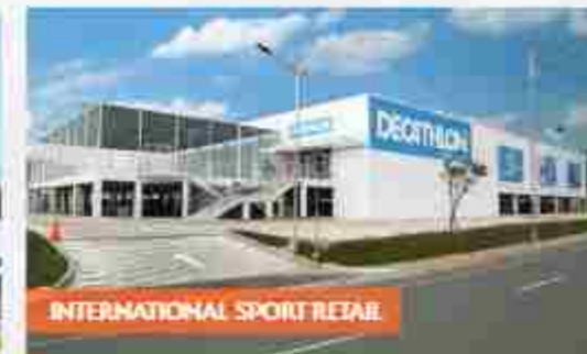
INTERNATIONAL SPORT RETAIL