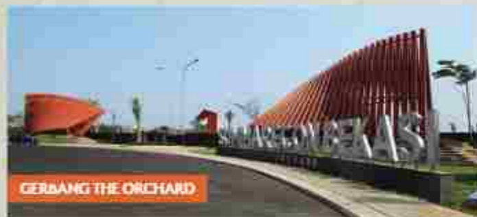
GERBANG THE ORCHARD

THE ORCHARD merupakan pengembangan kawasan hunian terbaru dari Summarecon Bekasi seluas 30 Ha dengan konsep Nature Smart Living . The Orchard Summarecon Bekasi mempersembahkan 5 cluster hunian modern yang dilengkapi teknologi terkini yang ramah lingkungan dengan mengutamakan keharmonisan hidup