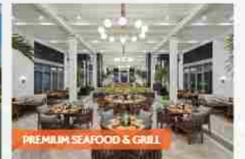
PREMIUM SEAFOOD & GRILL