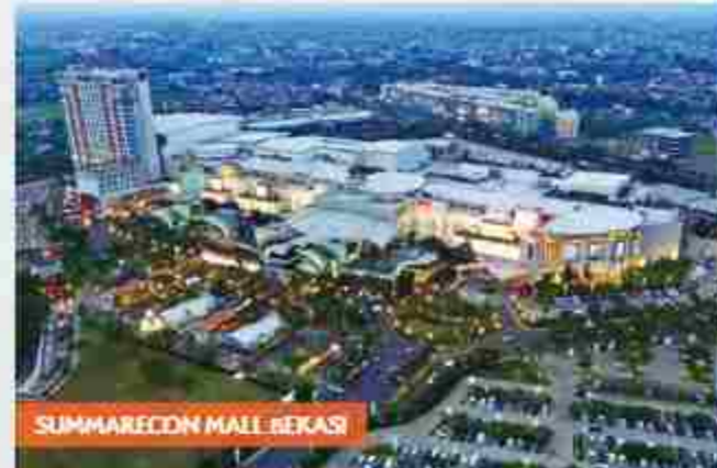
SUMMARECON MALL BEKASI