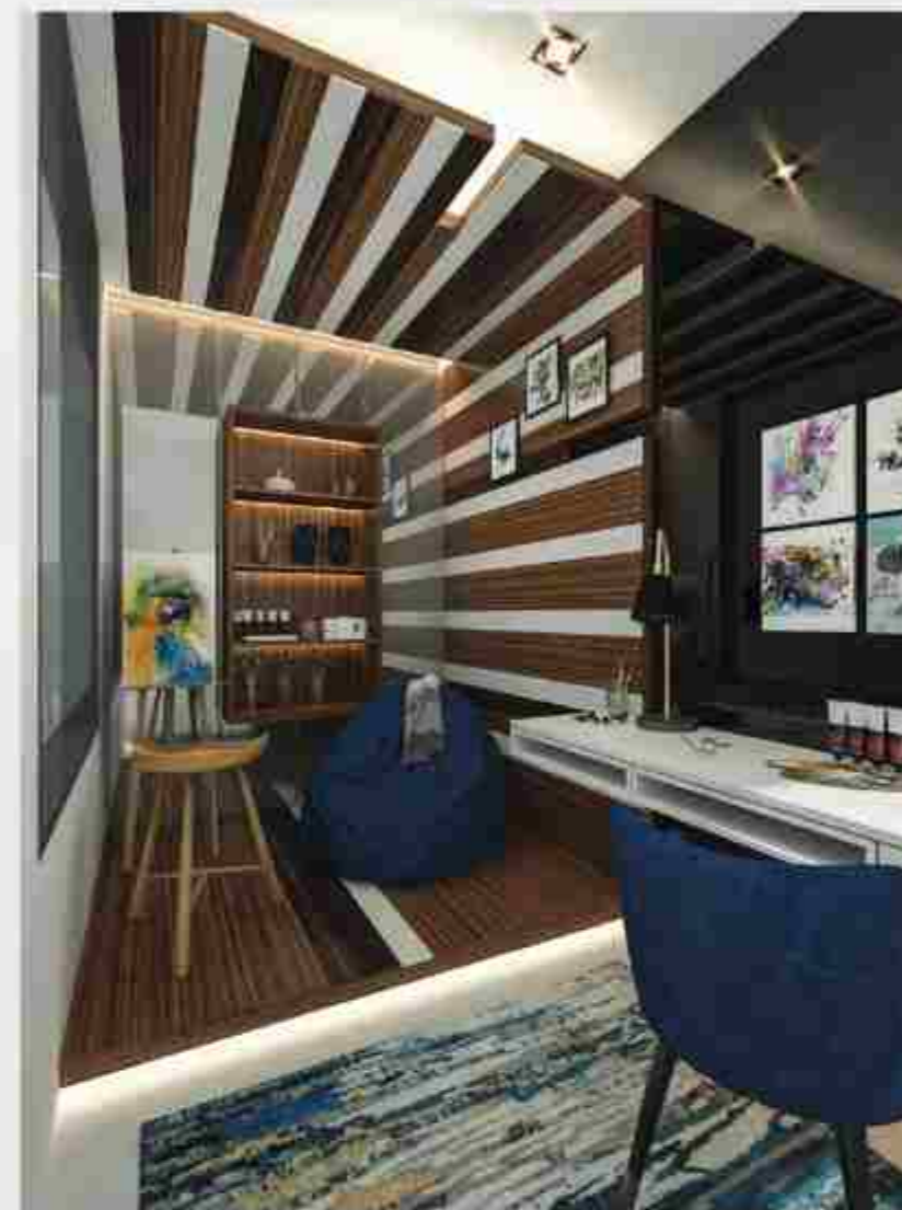
SHOW UNIT PLUM L7 PREMIUM