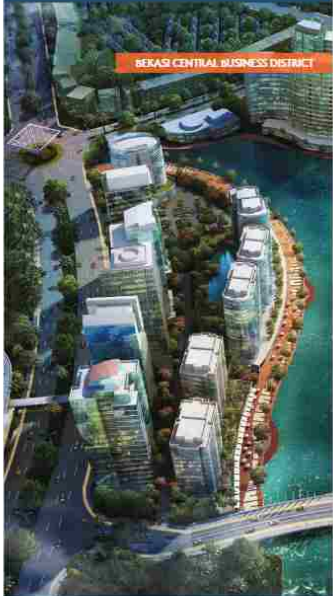
BEKASI CENTRAL BUSINESS DISTRICT