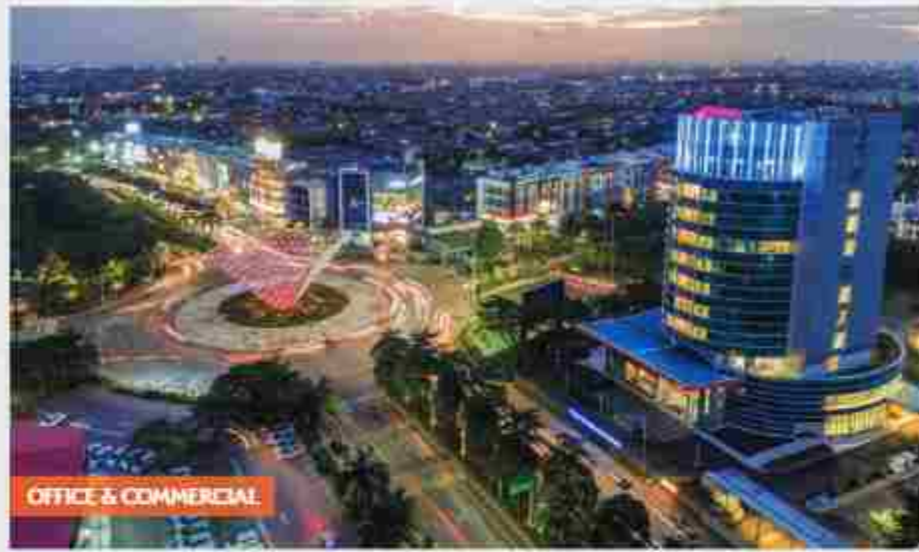
OFFICE & COMMERCIAL

Summarecon Bekasi telah menjadi ikon kawasan hunian prestis yang nyaman dengan lingkungan asri, pusat komersial terkemuka dengan berbagai fasilitas modern berskala kota, berkonsep smart city development melalui penyediaan jaringan fiber optic berkecepatan tinggi hingga 10 TB/s, penerapan teknologi Solar Panel hingga penggunaan lampu LED di PJU, Face Recognition Gate System , Smart Home with Panic Button , dll.