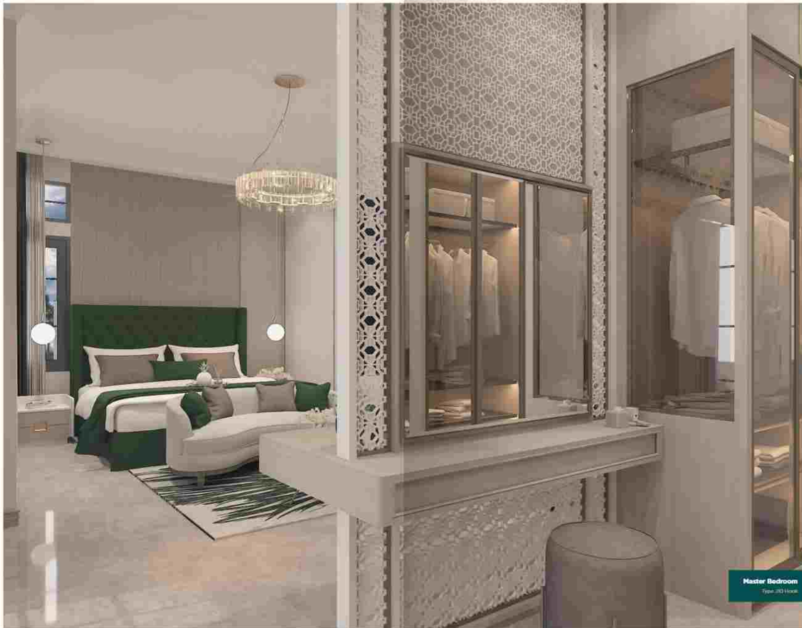
Master Bedroom Type 203 Home

Disclaimer: Seluruh data dan gambar yang tercantum pada brosur ini berdasarkan situasi dan kondisi pada masa penulisan, perubahan dapat terjadi sewaktu-waktu dan merupakan hak pribadi pengembang